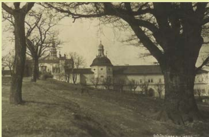
pohlednice z třicátých let minulého století

Dub byl odjakživa symbolem síly a odolnosti a jako takový získal výsadní postavení ve všech významných evropských kulturách. Považovali si jej Slované i Germáni, Keltové, Řekové i Římané. Prastaré duby jsou také symbolem stálosti a dlouhověkosti, proto se pod nimi odpradáva dávaly sliby a uzavíraly smlouvy. Od poslední doby ledové (tzn. 7000 let) jsou duby letní neodmyslitelnou součástí evropské krajiny.