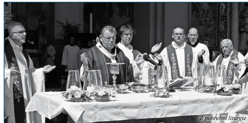
Z pohřební liturgie

Začátek exercicií je první uvedený den v 17.30 hodin večer v refektáři kláštera. Datum i čas konce exercicií je uveden u konkrétních kurzů. Přihlášky jen písemně: Římskokatolická farnost u kostela Nanebevzetí P. Marie Příbram - Svatá Hora, Exerciční dům, 261 01 Příbram II/591 nebo e-mailem na adrese ex.dum@svata-hora.cz případně vyplněním formuláře na http://www.svata-hora.cz . Informace: +420 731 619 800.