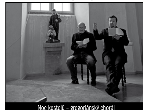
Noc kostelů – gregoriánský chorál

☐ V pátek 1. června proběhla letošní Noc kostelů . Návštěvníci měli možnost vybrat z pestré programové nabídky (byla otištěna v minulém čísle časopisu). Nejspíš největší pozornosti se těšila Noční světelná prohlídka baziliky, při níž byly konkrétní části ztemnělého prostoru chrámu (které v ten či onen okamžik byly předmětem výkladu) – štuky, obrazy, atp. – osvětleny úzkým kuzelem světla, aby na závěr zazářil speciálně osvětlený, i když o některé části ochuzený stříbrný oltář.