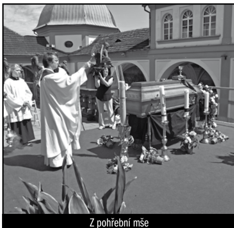
Z pohřební mše

mši v tasovickém farním kostele, která byla sloužena v úterý 19. června 2012 v 15.00 hodin. R.I.P.