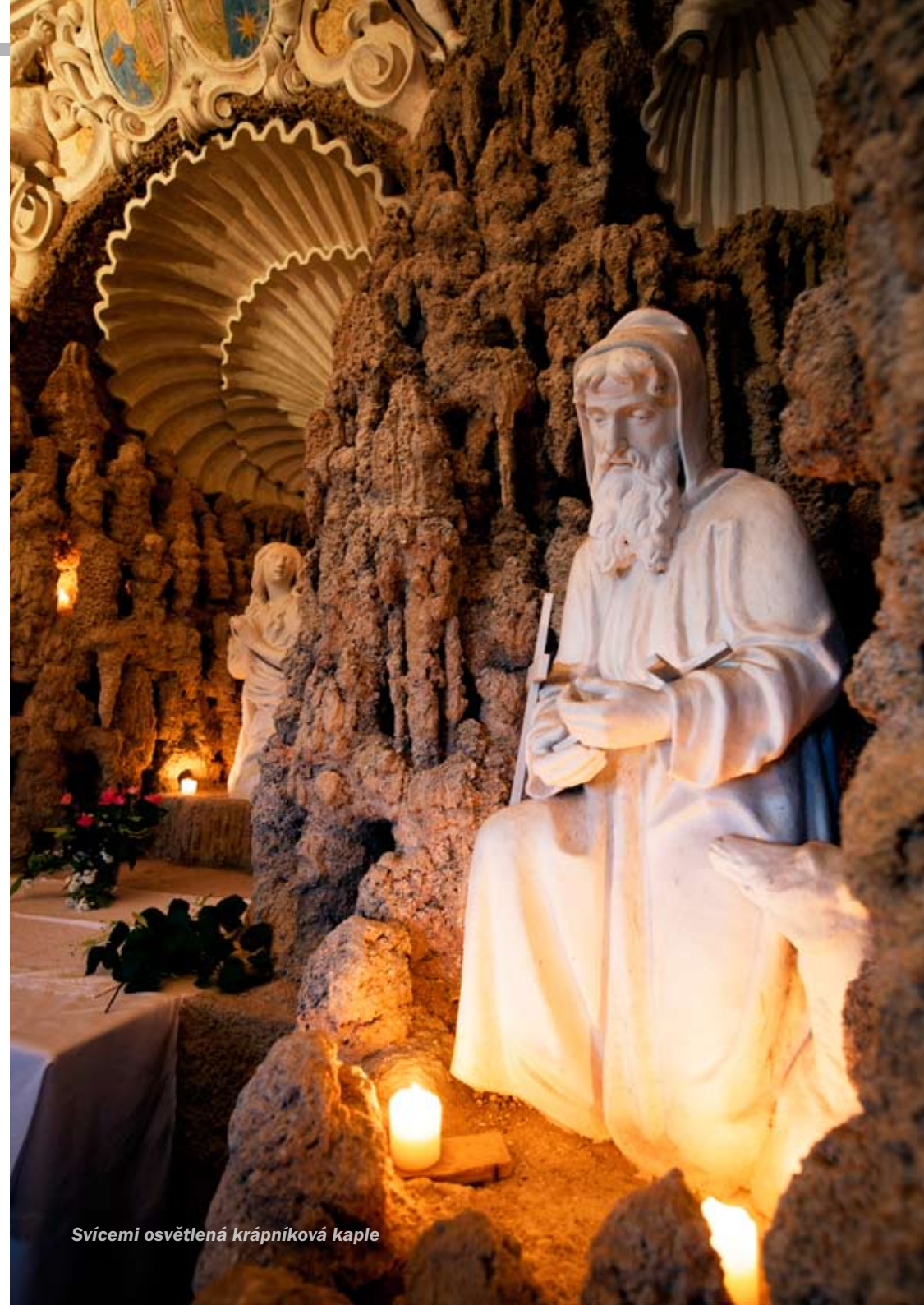
Svícemi osvětlená krápníková kaple

BANKOVNÍ SPOJENÍ Česká spořitelna, a. s., č. ú. 523967309/0800. Zájemci o pravidelné odebírání pište na adresu redakce.