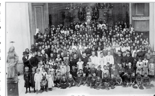
Italští vysídlenec na Svaté Hoře v červenci 1917

Kromě toho, že Svatá Hora byla pro vysídlenec cílem jejich, podle možnosti, pravidelně konaných poutí, byla pro ně také místem setkání s ostatními příbuznými a známými, kteří byli rozptýleni po nejrůznějších obcích a městech Čech a Moravy. Svatá Hora a svatohorská Madona jim byly o to bližší, neboť, jako lid zbožný, chovali zvláštní úctu k Panně Marii. Svatá Hora jim navíc připomínala mariánské poutní místo v Pině, nedaleko Trenta. Příležitost k setkání s Bohem prostřednictvím Panny Marie Svatohorské a s blízkými činilo pro vysídlenec Svatou Horu místem, kde čerpali sílu a naději pro svůj nelehký každodenní život vyhnanců, navíc sužovaný válkou.