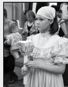
Fotografie na titulní straně časopisu: