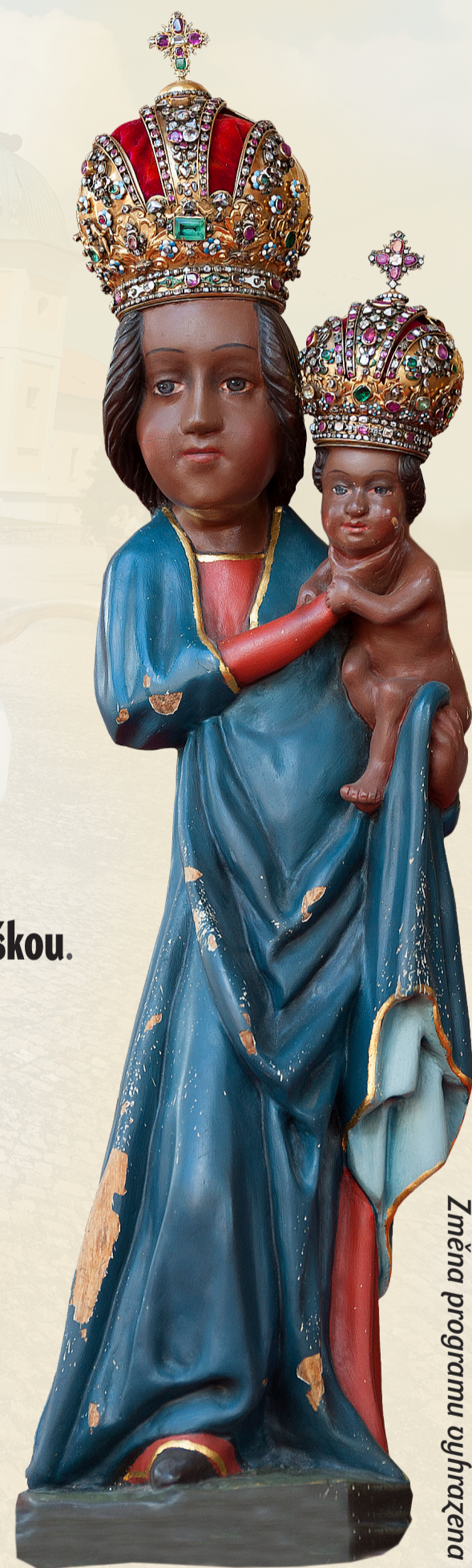
Změna programu vyhrazena

Nové aktivity na Svaté Hoře Vám nabízíme díky projektu, který je spolufinancován Evropskou unií v rámci IOP Projekt CZ.1.06/5.1.00/24.09583 „Příbram - Svatá Hora - vzorová obnova poutního areálu“