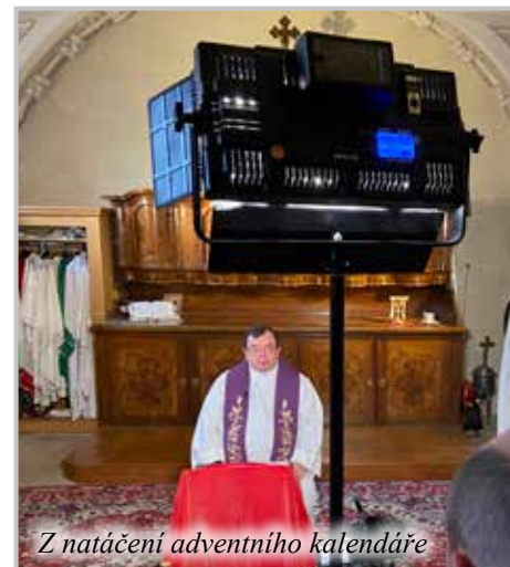
Z natáčení adventního kalednáře