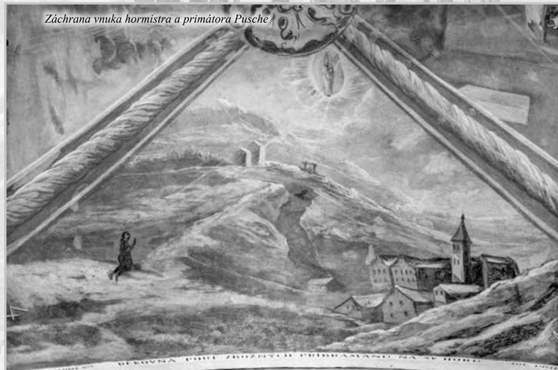
Záchrana vnuka hormistra a primátora Pusche

Primátor a hormistr Pusch klečí před císařem, detail z medaile 1728