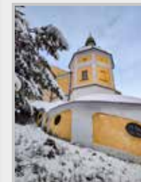
Fotografie na titulní straně časopisu:

Plzeňská kaple od svatohorských schodů