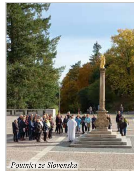
Poutníci ze Slovenska