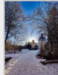
Fotografie na titulní straně časopisu:

Průčelí Svaté Hory, jak ho uvidí příchozí ze Staré Příbramě