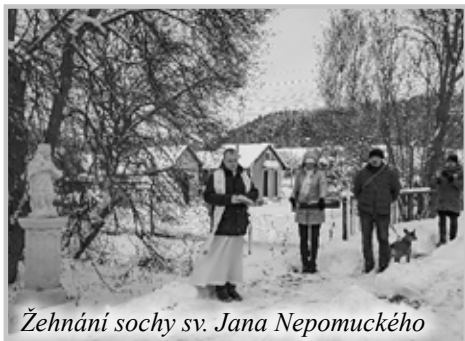
Žehnání sochy sv. Jana Nepomuckého