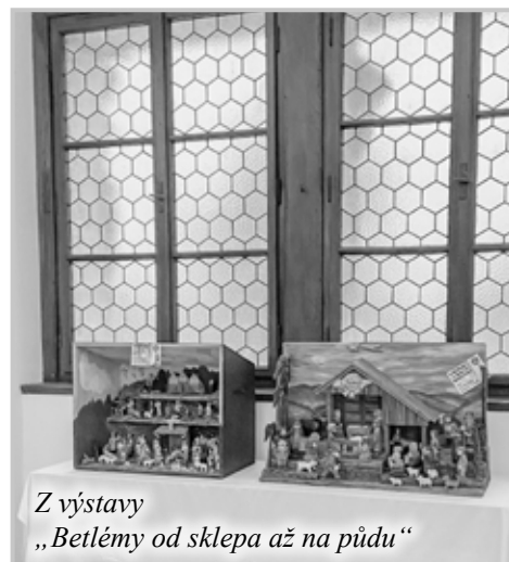
Z výstavy „Betlémy od sklepa až na půdu“

V závorce je uveden počet osob + počet kněží. Toto je záznam poutníků, o nichž víme nebo se nám přihlásili a slavili mši svatou. Především jednotlivci a malé skupinky, které se nepřihlášely například při příchodu v sakristii, nejsou v naší evidenci. 9. prosince - ČR Mníšek pod Brdy (48+1); 13. ledna - Chorvatsko (2+1)