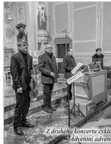
Z druhého koncertu cyklu Adventní advent