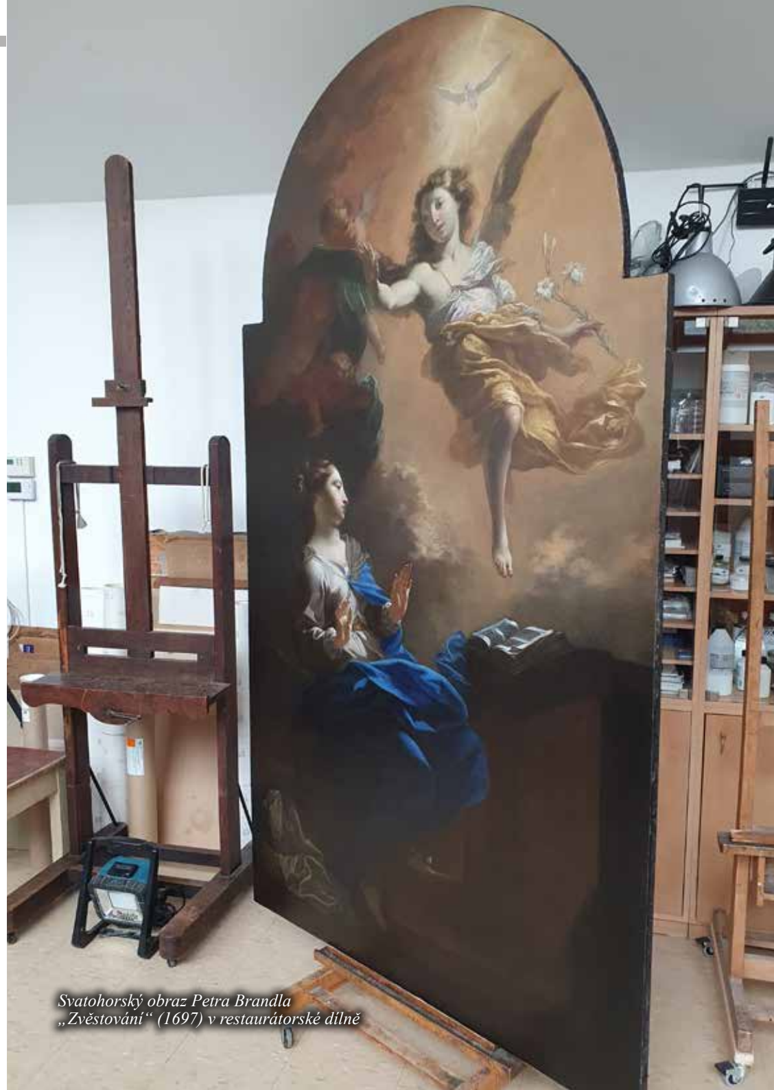
Svatohorský obraz Petra Brandla „Zvěstování“ (1697) v restaurátorské dílně

BANKOVNÍ SPOJENÍ Česká spořitelna, a. s., č. ú. 523967309/0800. Zájemci o pravidelné odebírání, pište na adresu redakce.