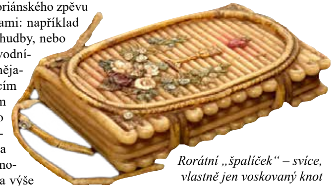
Rorátní „špalíček“ – svíce, vlastně jen voskováný knot svinutý např. do tvaru knihy: dobře drží na lavici a poskytuje světlo pro zpěv rorátů

Roráty, jak již výše bylo řečeno, vznikly tzv. tropováním, a to ještě dvojitým. „Tropus“ (zhruba přeloženo „vsuvka“) je označení pro skladbu, která vzniká na základě původního gregoriánského zpěvu jeho nejrůznějšími obměnami: například vsouváním nového textu i hudby, nebo prostým přetextováním původního gregoriánského zpěvu nějakým významově souvisejícím novým textem, často v jiném jazyce než v latině – takto vznikla například z původního gregoriánského aleluja velikonoční píseň Bůh všemohúcí. Autoři rorátů užíli oba výše zmíněné způsoby současně: podložili původní gregoriánské melodie novým českým textem a poté na několik částí „rozstříhaný“