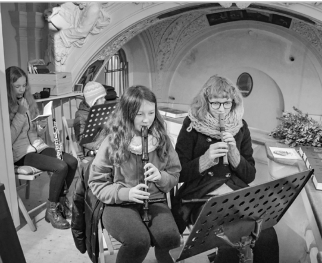
Svatohorští literáti na rorátní mši v roce v roce 2018

Obliba rorátů a současné zvýšené nároky na liturgii spolu se změnou vkusu v 19. století i změnou liturgie v 60. letech minulého století (po II. vatikánském koncilu) postupně přinesly rorátům drastickou devastaci: ve snaze přizpůsobit je současným požadavkům došlo k jejich mrzačení. Byl porušen systém střídání chorálních částí s vloženými písněmi, původní časoměrný barokní verš byl změněn na přízvučný (jak můžeme vysledovat ve srovnání původní verze Michnovy písně „Z nebe posel vychází“ v Mešních zpěvech používaných zejména v Praze a větších městech s jeho „variantou“ v Kan-