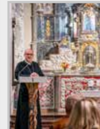
Fotografie na titulní straně časopisu:

Fenomén Zálánská madona 20 Zajímavá kniha 26 Exercicie, kalendář akcí 29 Pravidelné bohoslužby, otevírací doba 30