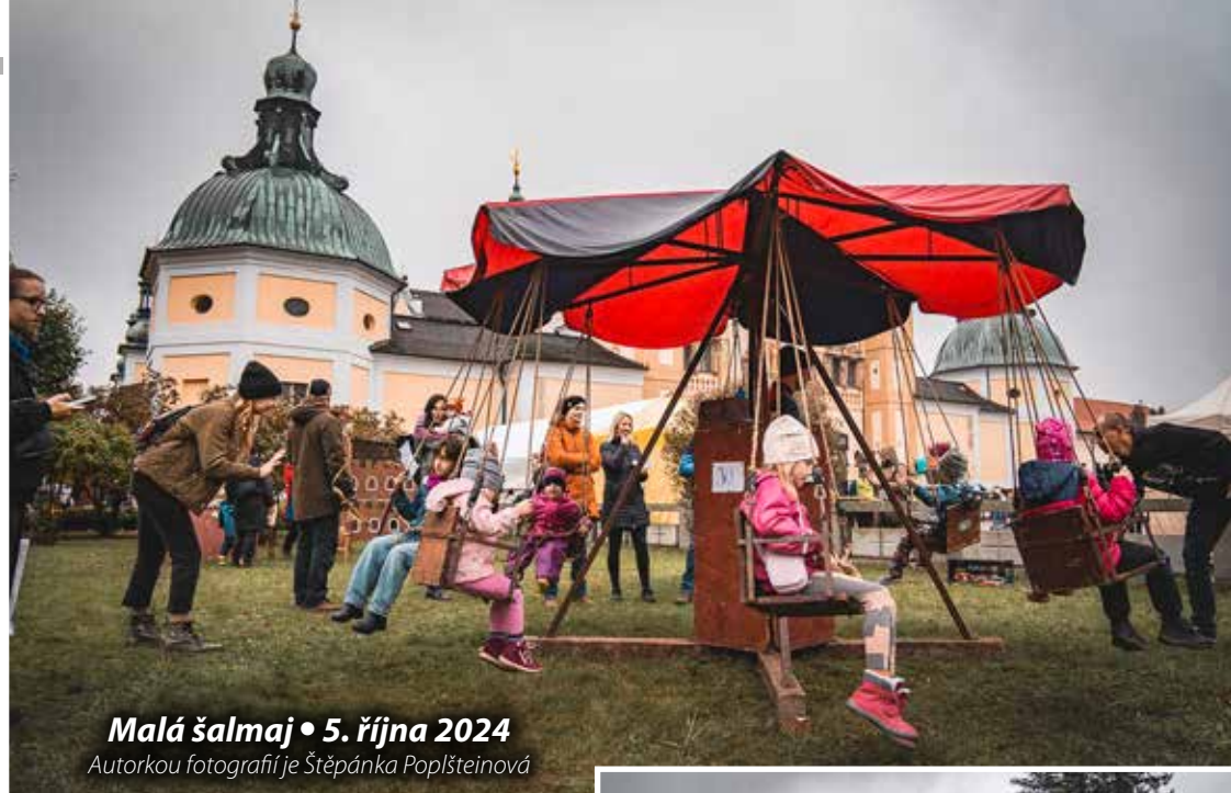
Malá šalmaj • 5. října 2024

BANKOVNÍ SPOJENÍ Česká spořitelna, a. s., č. ú. 523967309/0800. Zájemci o pravidelné odebrání, pište na adresu redakce.