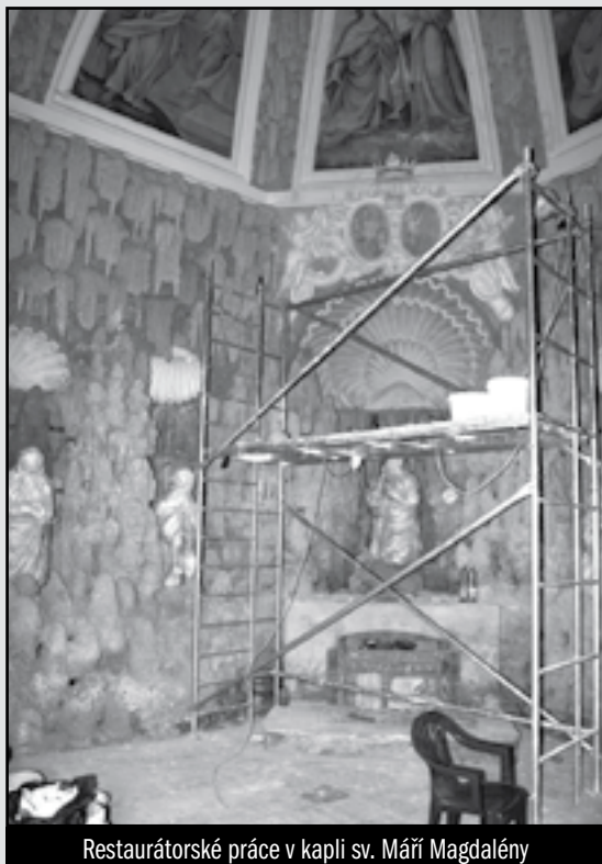
Restaurátorské práce v kapli sv. Máří Magdalény