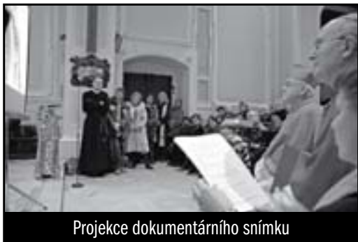
Projekce dokumentárního snímku

„z největší píšťaly“. Jedná se o starobylou tradici, kdy se žehná takové množství vína, které by bylo možné nalít do největší píšťaly varhan. U nových svatohorských varhan je to píšťala C pedálového rejstříku Principalbas a její objem je 78,2l. Zároveň 27. prosince slaví církev svátek svatého Jana. Tento svátek rovněž obsahuje zvyk žehnat víno. Požehnané víno pak bylo rozléváno při recepci do karaf s motivem stavby nových varhan. Nešpory byly zakončeny požehnáním a zpěvem písně „Narodil se Kristus Pán“.