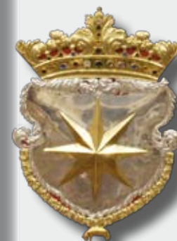
Fotografie na titulní straně časopisu: