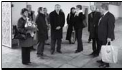
Návštěva z Itálie