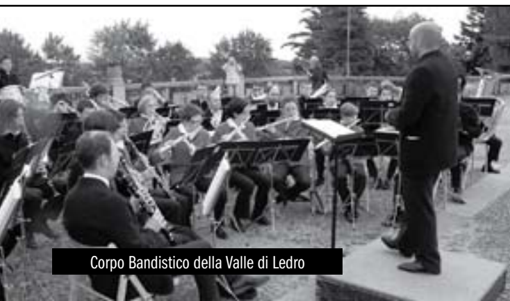
Corpo Bandistico della Valle di Ledro