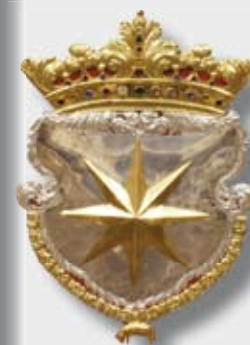
Fotografie na titulní straně časopisu: