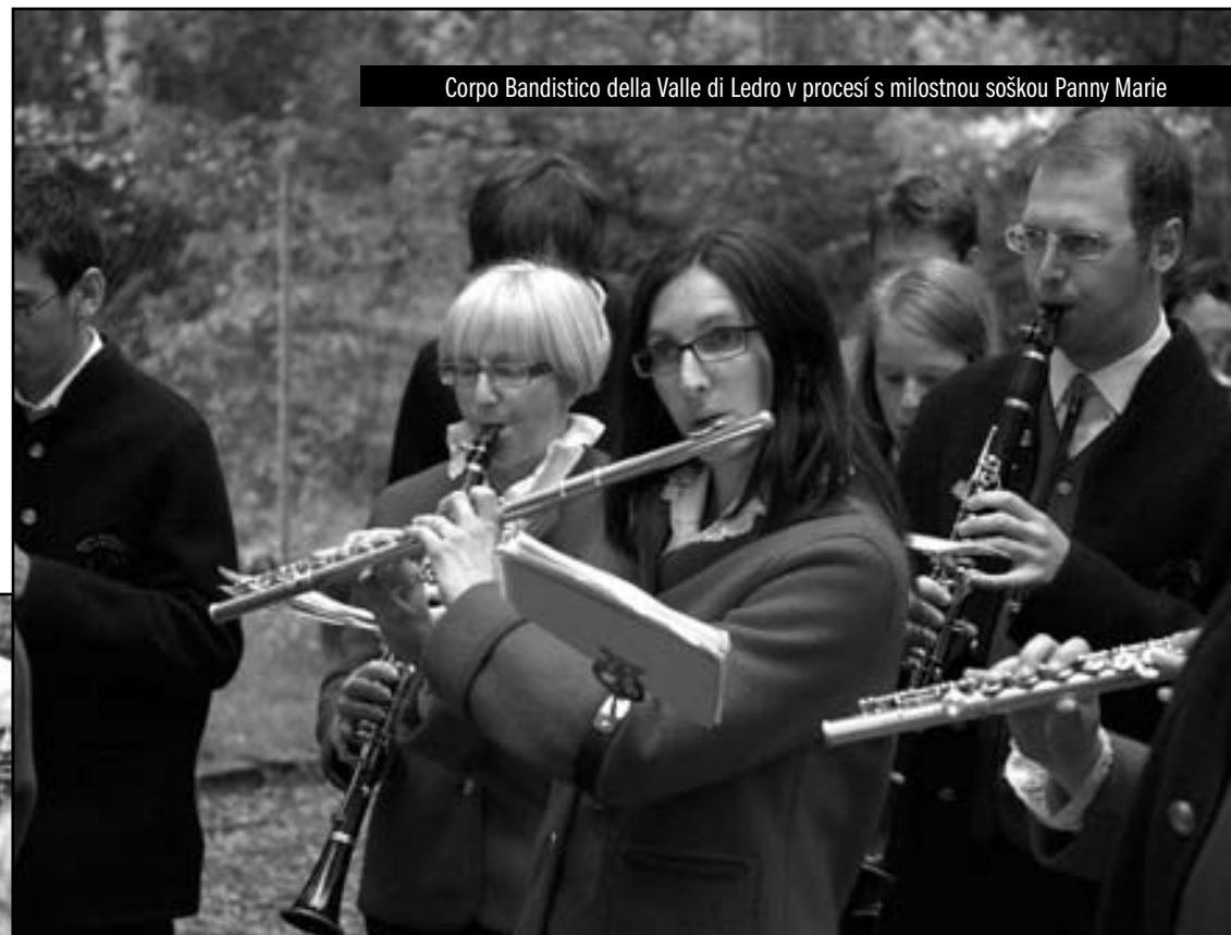
Corpo Bandistico della Valle di Ledro v procesí s milostnou soškou Panny Marie