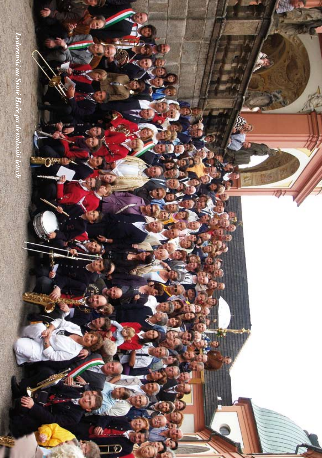
Ledereréni na Sväté Hoře po devädesiatí rokoch