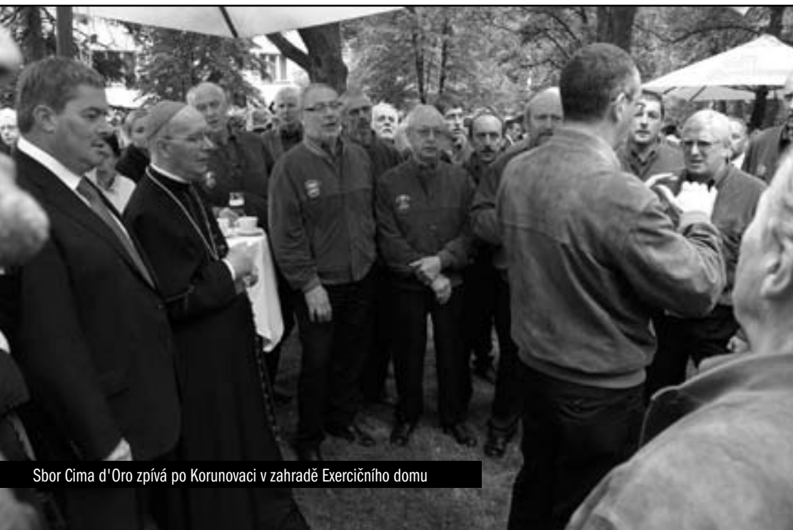
Sbor Cima d'Oro zpívá po Korunovaci v zahradě Exercičního domu