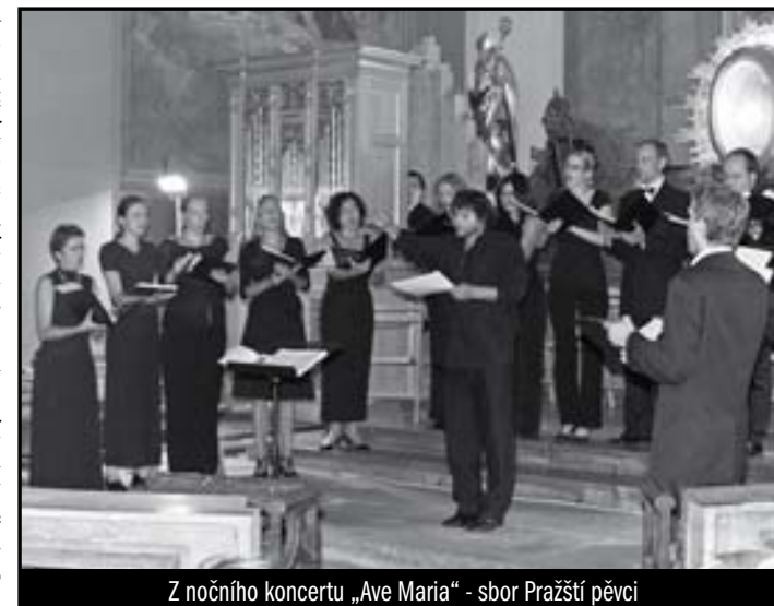
Z nočního koncertu „Ave Maria“ - sbor Pražští pěvci

Matice Svatohorská je sdružením přátel Svaté Hory. Jejich členství je odrazem snahy podílet se jakýmkoli způsobem – modlitbou, vlastní prací či finančním příspěvkem – na tom, aby toto poutní místo stále více rozkvétalo do krásy a všichni se zde cítili jako doma. Za všechny živé i zemřelé členy Matice Svatohorské a dobrodince Svaté Hory je každý pátek v bazilice v 7 hodin sloužena mše svatá.