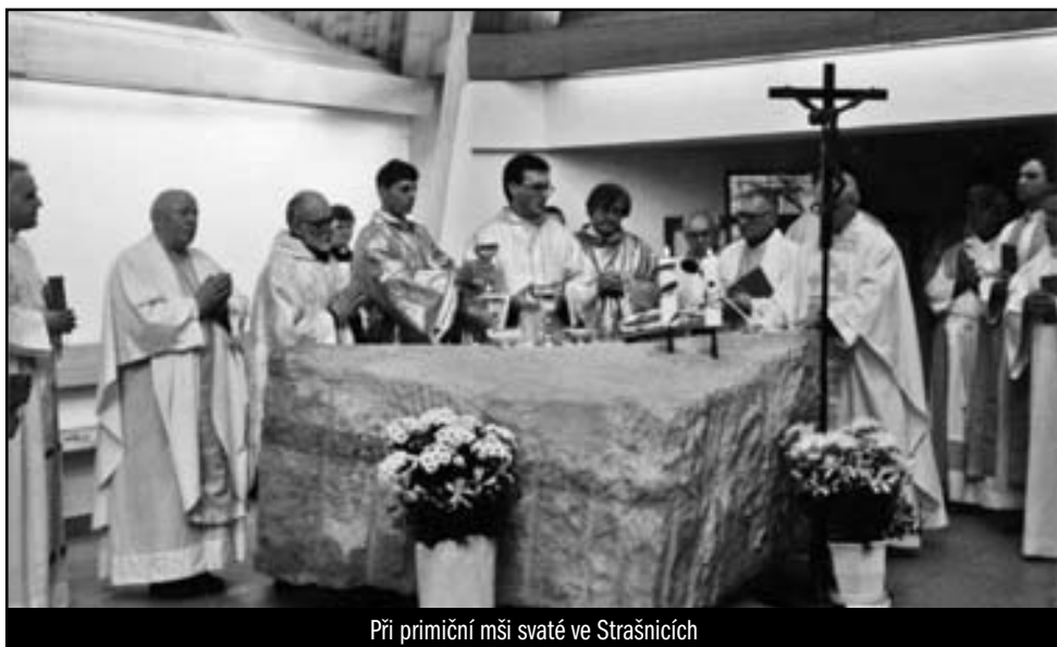
Při primiční mši svaté ve Strašnicích

Když jsem před maturitou, v říjnu 1989, měl ve škole oznámit, jak jsem se rozhodl o dalším studiu, a já oznámil, že chci být knězem, tak na mne učitelky trošku křičely. Bylo to ale z jejich strany spíš ze strachu o můj budoucí život, než že by za tím byl nějaký zlý úmysl. Já vsuktu nevypadal na světce, byl jsem puberták s neustálou hrozbou dvojky z chování. Zavolať si mě také ředitel školy, kovaný komunista, tam už to bylo horší... Ale než se všichni vzpamatovali, byl tu listopad 1989. Ani doma to nebylo nejlehčí, možná těžší než ve škole, i když už to bylo na jaře roku 1990. Tatínek byl totiž bez vyznání a babička adventistka, takže moje rozhodnutí bylo chápáno jako zrada „rodinných kořenů“. Já jsem se pochopitelně bál, a tak jsem doma pořád mlžil a nechtěl jsem to říct. Maminka o tom věděla, ale také to tajila. Jednoho večera to ale prasklo, a stálo to za to. Byly zrovna Televizní noviny, tatínek ležel na otomanu a v televizi hlásili: „Dnešní den je posledním dnem, kdy lze podat přihlášky na vysokou školu...“ Prásk! Táta vstal a říkal: „Tak tys nepodal přihlášku na vysokou školu? Bude z tebe blbec! A budeš muset na vojnu!“ Když jsem odpověděl, že jsem ale přihlášku podal, a když přišla otázka: „A kam jsi ji podal?“ tak jsem ztratil řeč. Maminka za mne odpověděla: