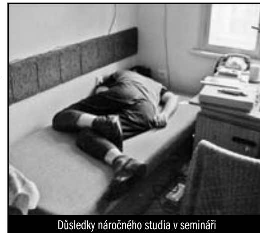
Důsledky náročného studia v semináři