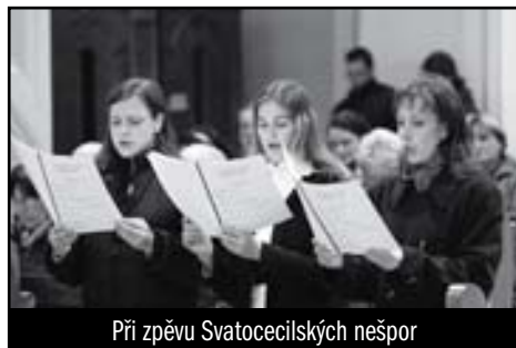
Při zpěvu Svatocecilských nešpor