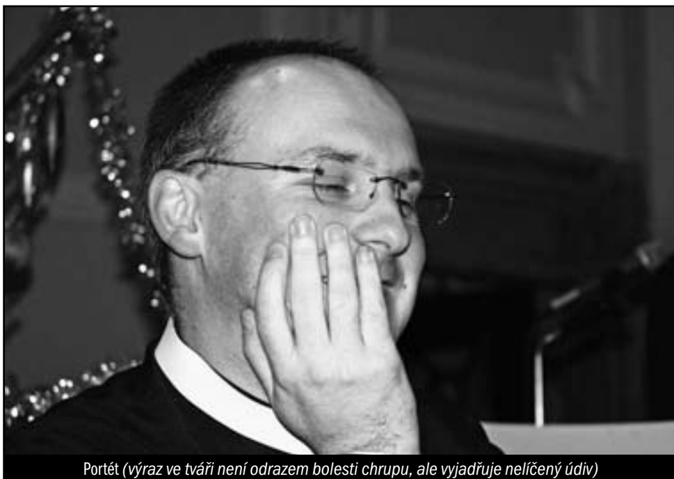
Portrét (výraz ve tváři není odrazem bolesti chrupu, ale vyjadřuje nelíčený údiv)