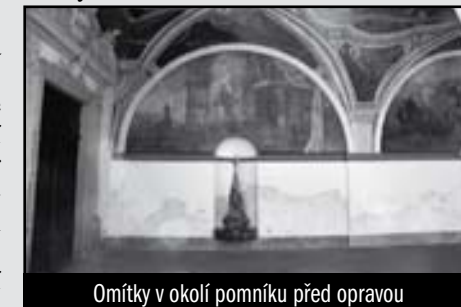
Omítky v okolí pomníku před opravou

vysídleným obyvatelům italského Valle di Ledro. Vápenná omítka, která byla na zdvo v letním období nanášena, vytvořila slané skvrny, které bylo možné odstranit pouze jejím sejmutím a nanášením nové vrstvy.