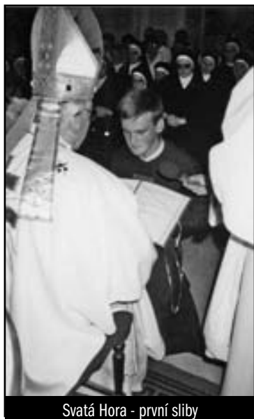
Svatá Hora - první sliby

Byla to tedy doba určitého osamostatnění se. Jak se v té době vyvíjel tvůj duchovní život?