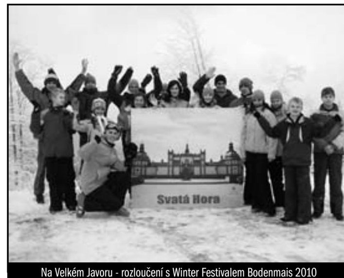
Na Velkém Javoru - rozloučení s Winter Festivalem Bodenmais 2010