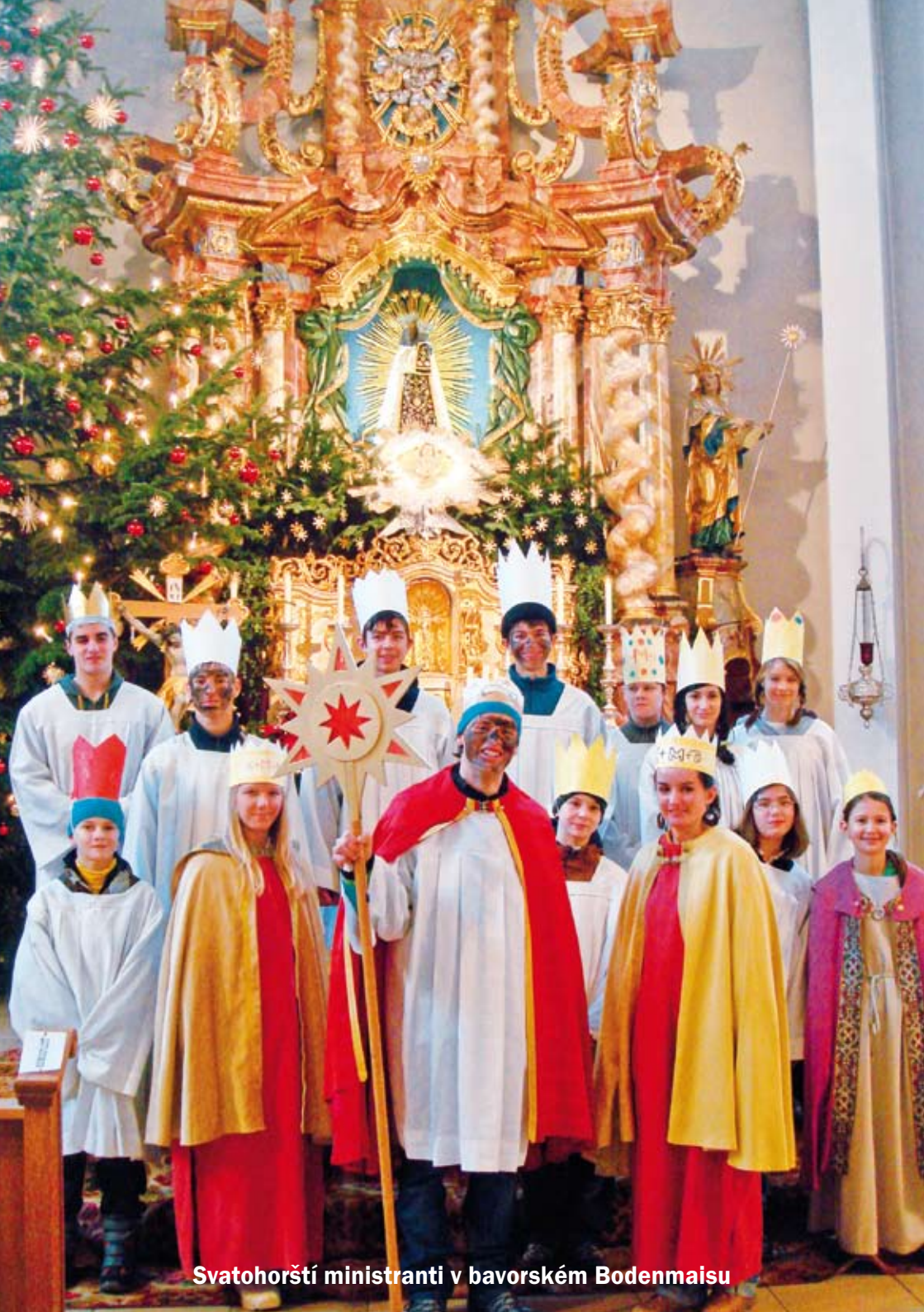
Svatohorští ministranti v bavorském Bodenmaisu