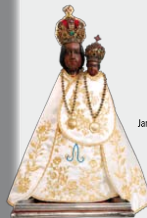
Fotografie na titulní straně časopisu:

Ale on mi odpověděl: jen jdi temnotou a vlož svou ruku do ruky Boží, to je lepší než světlo a jistější než známá cesta.