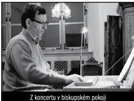
Z koncertu v biskupském pokoji