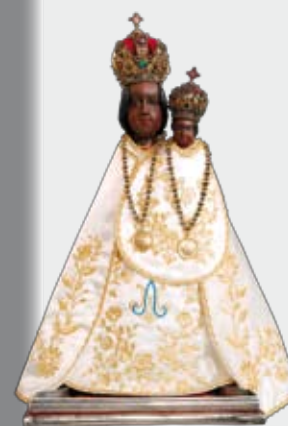
Fotografie na titulní straně časopisu: