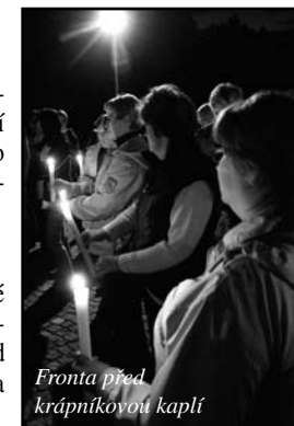
Fronta před krápníkovou kaplí

Při sledování sobotních Událostí jsem zaznamenal zprávu o Noci kostelů na Svaté Hoře. Moderátorka popisovala zajímavý program, včetně možnosti navštívit Krápníkovou kapli. Přestože jsem jako turista na Svaté Hoře byl již několikrát, hned jsem nasedl do auta a vyjel na Svatou Horu, abych mohl zažít netradiční pohled na její prostory. A nebyl jsem zklamán.