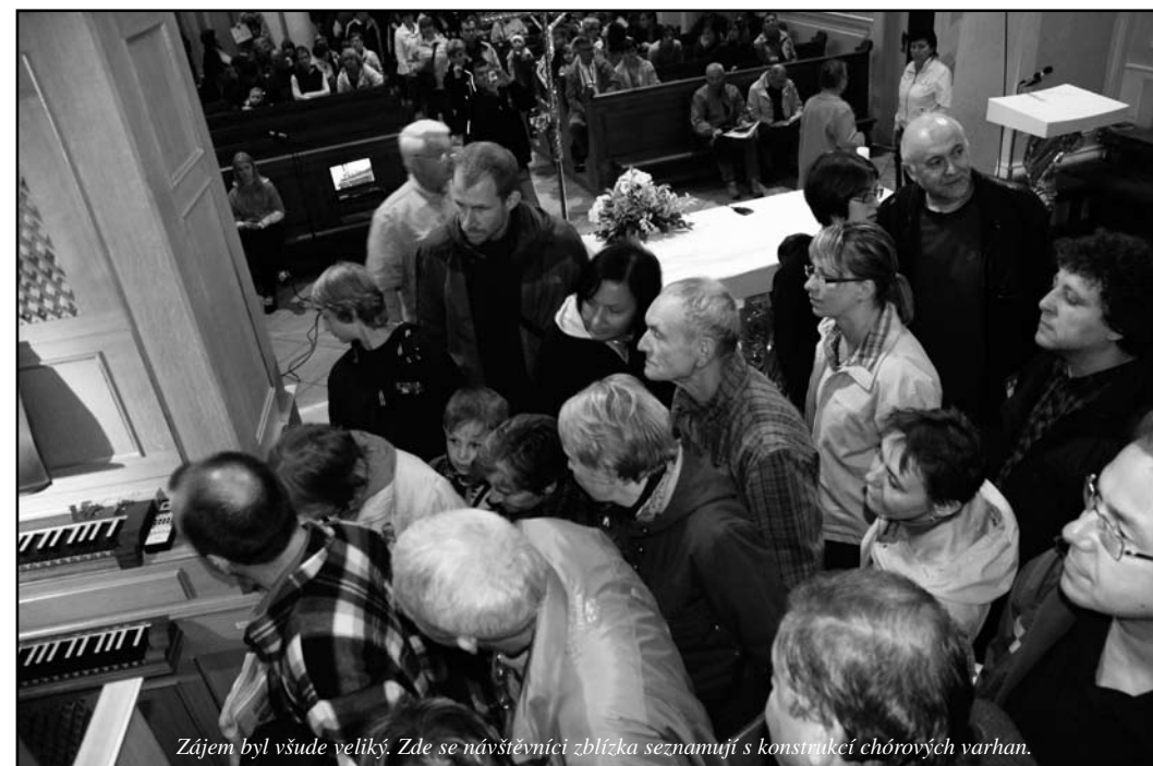
Zájem byl všude veliký. Zde se návštěvníci zblízka seznamují s konstrukcí chórových varhan.