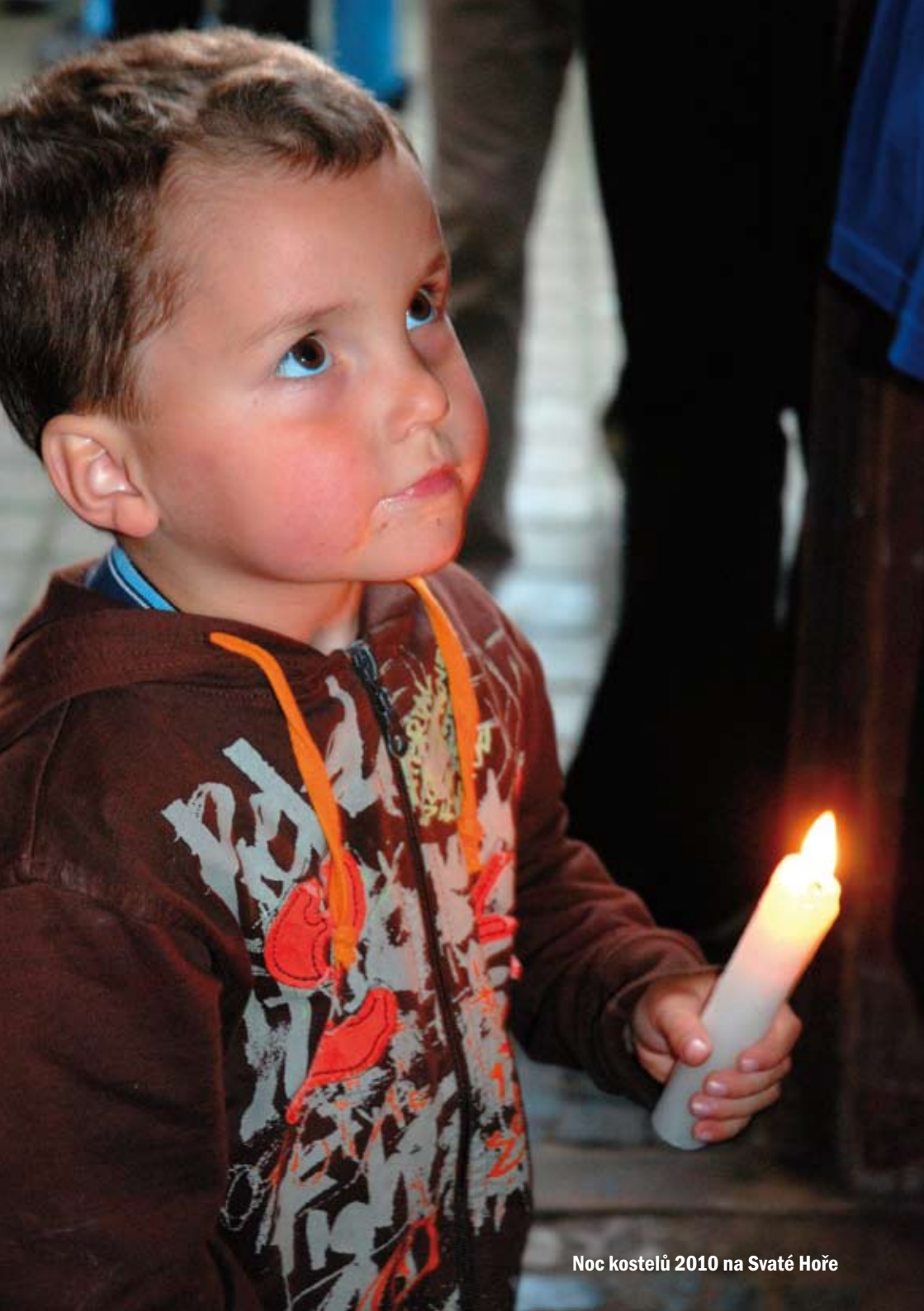
Noc kostelů 2010 na Svaté Hoře