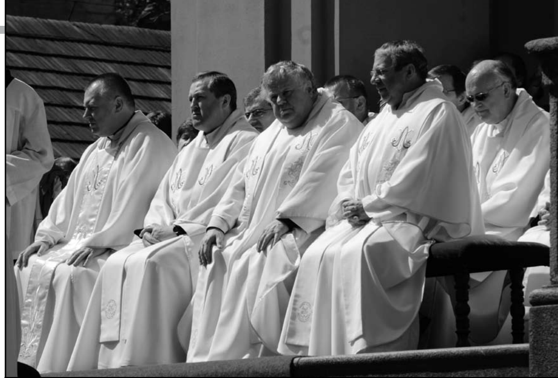
Z 9. arcidiecézní pouti za duchovní povolání