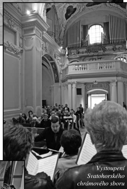
Vystoupení Svatohorského chrámového sboru