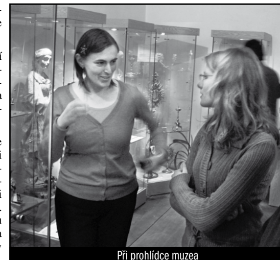
Při prohlídce muzea