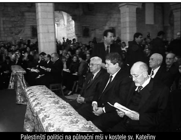
Palestínští politici na půlnoční mši v kostele sv. Kateřiny

Ač reklamy a nabídky akcí v nejrůznějších letáčích a médiích na mne působí poněkud odpudivě, jedna loňská reklama mne přece jen trochu oslovila. Lákala totiž k prožití vánočních svátků přímo v Betlémě. Dlouho jsem s touto myšlenkou koketoval. Následná smrt Jásira Arafata a s ní související obavy z politického vývoje v Palestině mě dovedly k tomu, že jsem myšlenku prožít vánoční svátky přímo v Betlémě opustil.