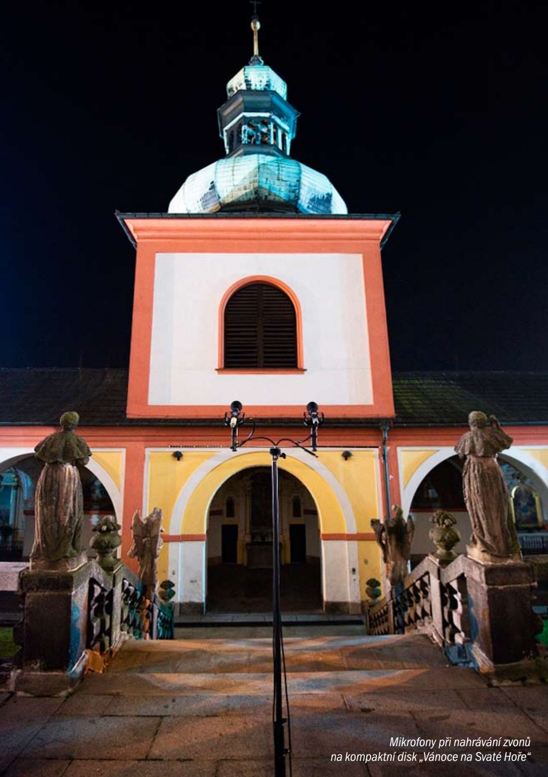
Mikrofony při nahrávání zvonů na kompaktní disk „Vánoce na Svaté Hoře“