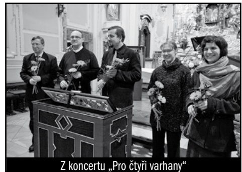
Z koncertu „Pro čtyři varhany“