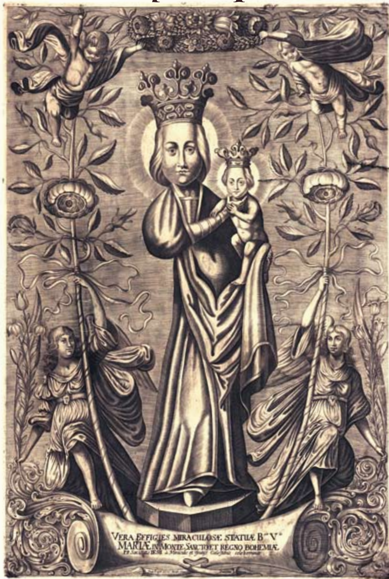
Vstupenky v předprodeji ve Svatohorském poutním muzeu