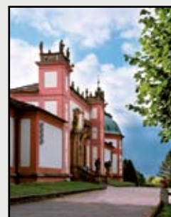
Fotografie na titulní straně časopisu: