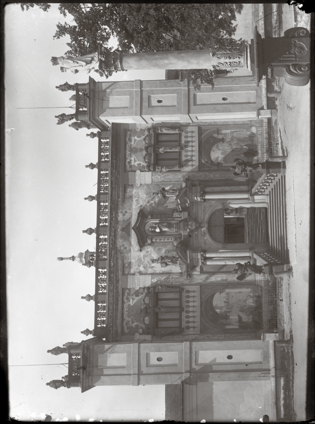
Svatohorské průčelí s iluzivními malbami