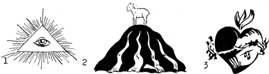
NAŠE SOUTĚŽ, 3. úkol:

Co znamenají tyto znaky, které vidáš tak často v kostele?