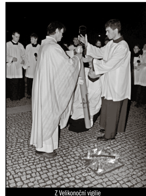
Z Velikonoční vigílie