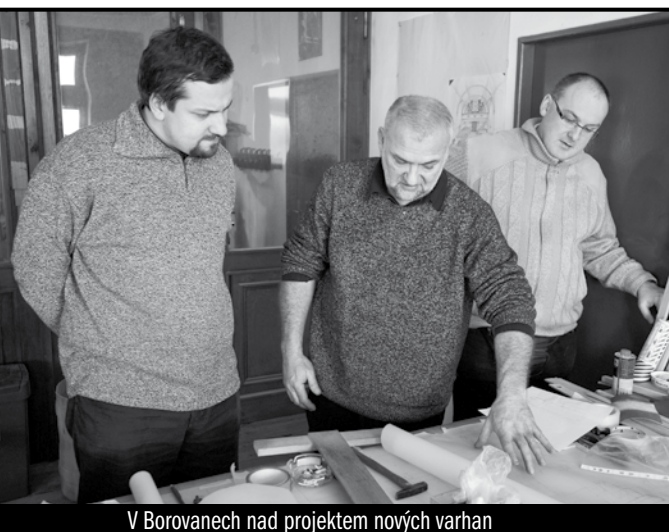
V Borovanech nad projektem nových varhan