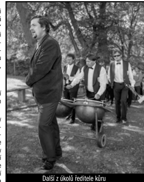
Další z úkolů ředitele kůru