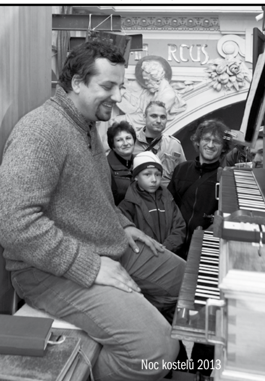
Noc kostelů 2013

Sžití se s novým – tedy vlastně mým prvním oficiálním – působištem bylo velmi rychlé. A protože na rozdíl od plzeňské katedrály, kde jsem o víkendech varhanil několik let před příjezdem na Svatou Horu, bylo na Svaté Hoře opravdu hodně živo. A to nejen co do počtu liturgií, ale též ohledně nutnosti zkoušení se sborem a dalších aktivit, přípravy na Vánoce 2001 byly velmi příjemné. Na nějaký stesk nebyl čas, jen půlnoční jsem v následujících letech hrál o Vánocích tři – Na Sv. Hoře v 16.00, v Obořišti ve 22.00 a později i ve Višňové o půlnoci.