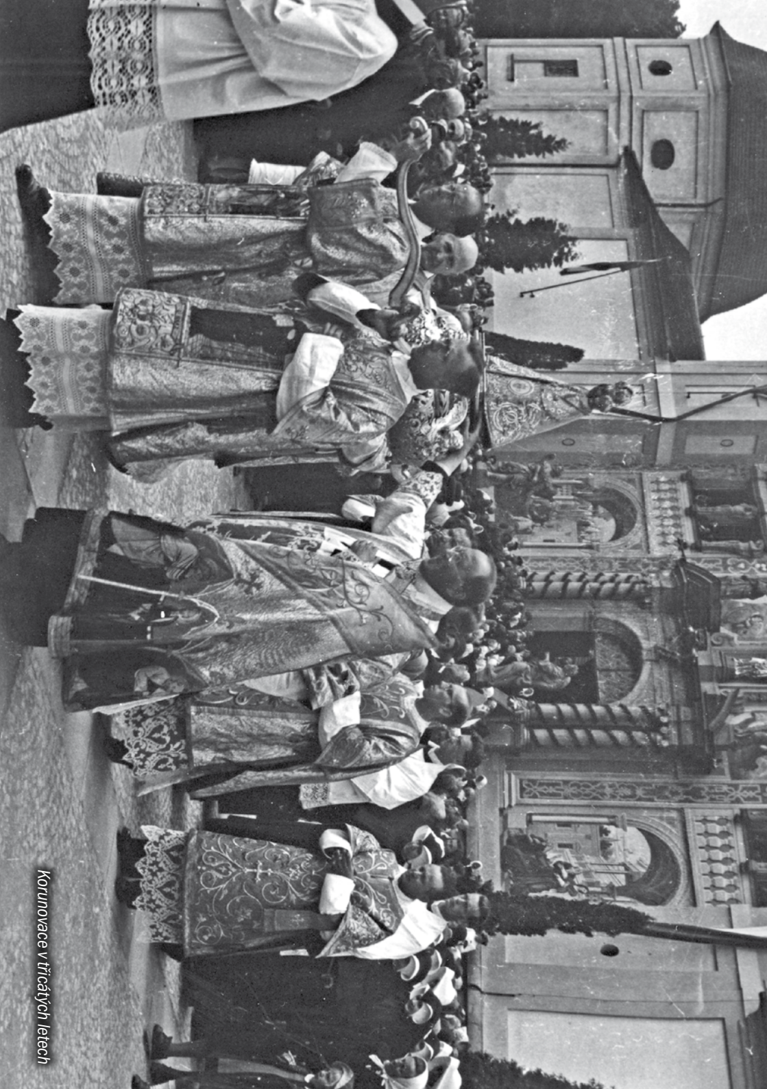
Korunovace v třicátých letech