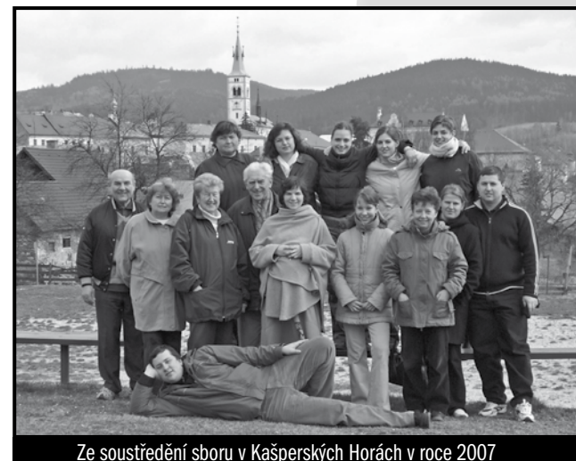
Ze soustředění sboru v Kašperských Horách v roce 2007