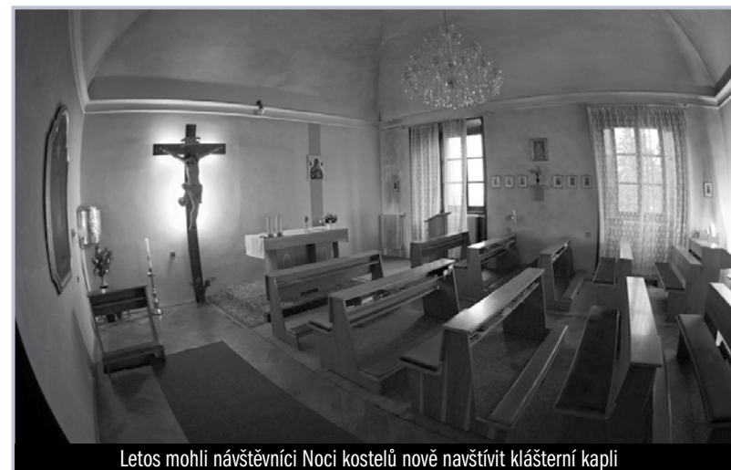
Letos mohli návštěvníci Noci kostelů nově navštívit klášterní kapli

Různorodý program nabídl také prostor baziliky. Tříkrát za večer proběhla světelná prohlídka kostela spočívající ve výkladu k postupně osvětlovaným částem výzdoby a vybavení baziliky. Bylo možné se účastnit exkurze o varhanách u kůru pod vedením svatohorského regenschori Pavla Šmolíka. Od 22 hodin pak svatohorské chórové varhany v rámci koncertu rozezněl přední český varhaník Jaroslav