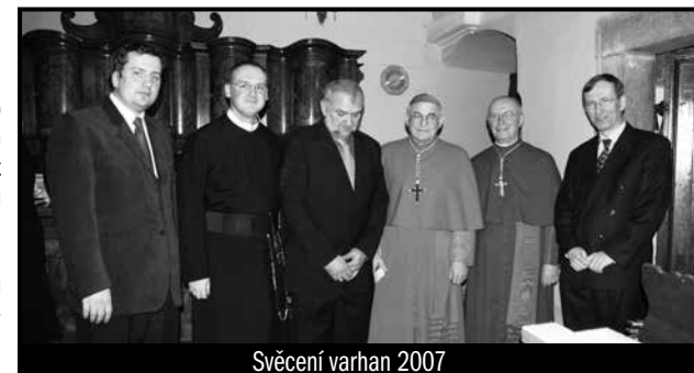
Svěcení varhan 2007

Snad nejběžnější a nejpoužívanější kompozicí, kterou jsem věnoval Svaté Hoře, a která stála opravdu mnoho úsilí a času, jsou české lidové nešpory. Dal jsem jim vzniknout s tím, že katedrály a baziliky by měly pečovat o modlitbu Hodin (breviář) a její zpívanou formu jsem považoval za nejlepší – vždyť většina breviářových textů jsou svou povahou zpěvy – hymnus, žalm, kantika... Nešpory vznikaly v několika etapách. Nejdůležitějším přelomem bylo odstranění sice nádherných, ale pro češtinu naprosto nevhodných gregoriánských nápěvů žalmů a jejich nahrazení nápěvy novými, které jsem vytvořil po studiu mnoha typů těchto melodií z pera předních českých skladatelů duchovní hudby tak, aby dobře odpovídaly dikci a přízvukům české prózy. Nešpory v současnosti jsou a snad i zůstanou nedílnou součástí svatohorského liturgického dění.