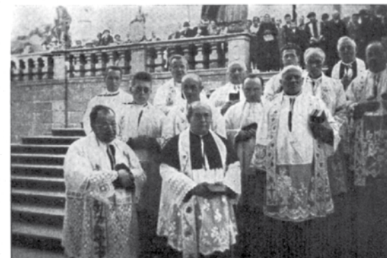
Část účastníků 1. kursu kněžských exercicií na Sv. Hoře po společném sv. přijímání.

Jsem členkou Matice na Sv. Hoře a miluji neskonale stánek Matičky Boží, a svoji víru v milostnou sošku Matičky s Jezulátkem mám za svoje největší bohatství. Prosim vřele, až bude kousek místečka v časopise »Svatá Hora«, aby bylo uveřejněno i moje poděkování. Děkuji Matičce svatohorské za milosti, které jsem si vyprosila v těžkých zkouškách života. Ať prosím