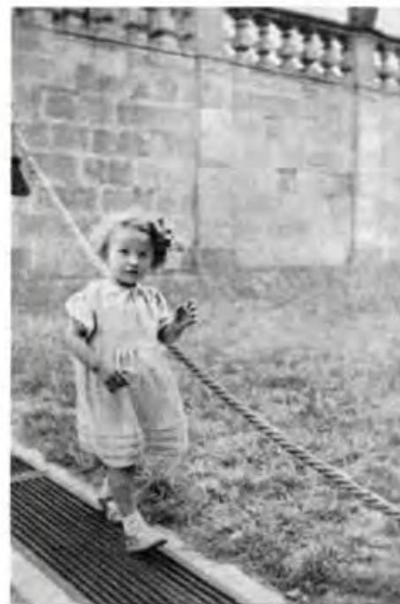
Z alba nejmenších návštěvníků Sv. Hory. Šťastné mládí!

Děkuji znovu ještě za laskavé přijetí na Sv. Hoře. A za tu radost, že jsem směl poslechnouti svatohorské zvony. Ještě dosud mně znějí v uších.