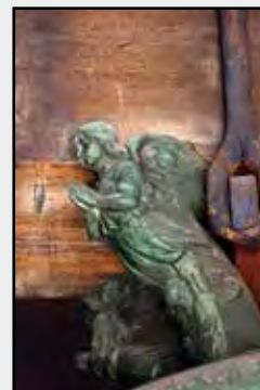
Fotografie na titulní straně časopisu:

Detail zavěšení (maskaron) jednoho ze svatohorských zvonů