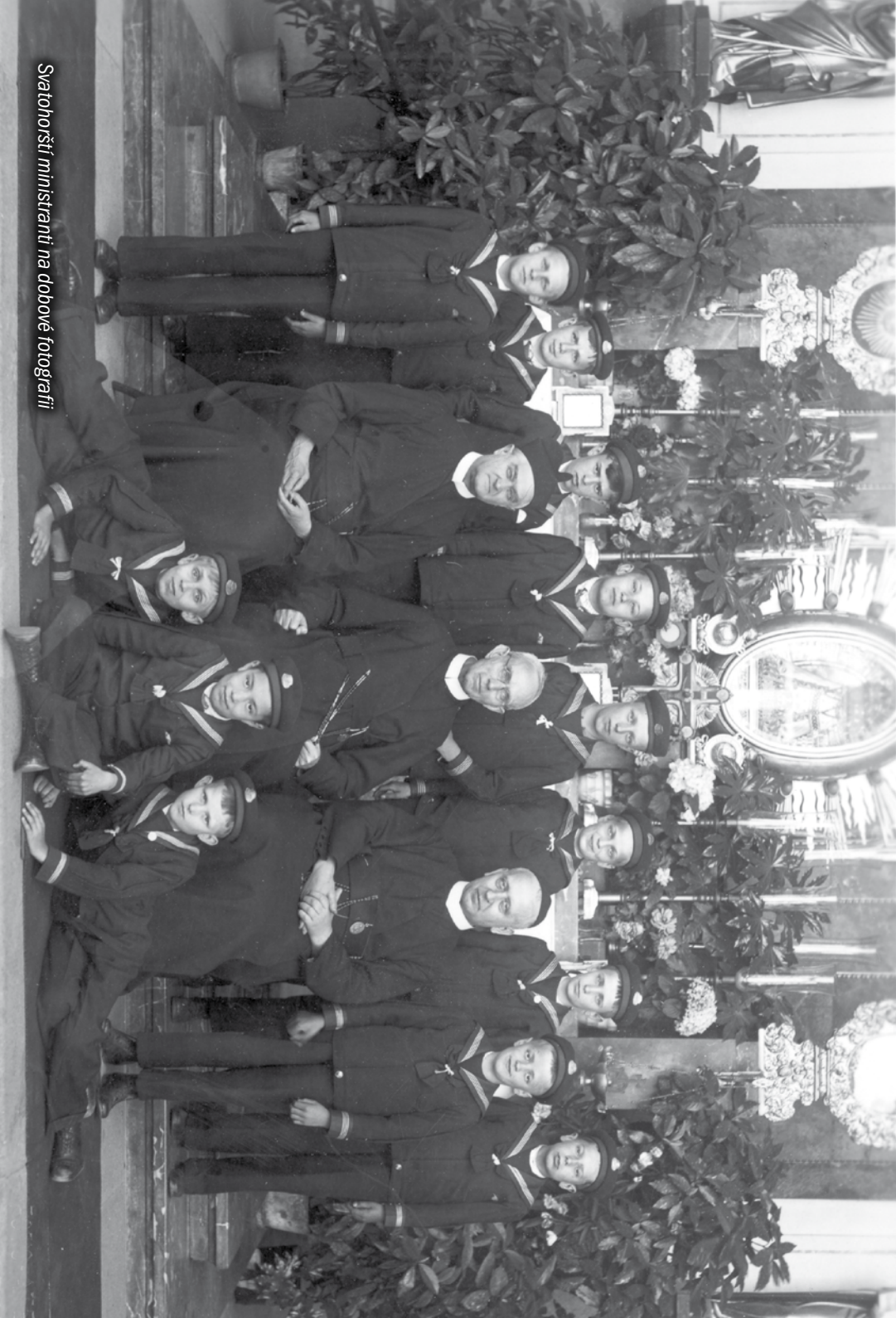
Svatohříšní ministři na dobové fotografii