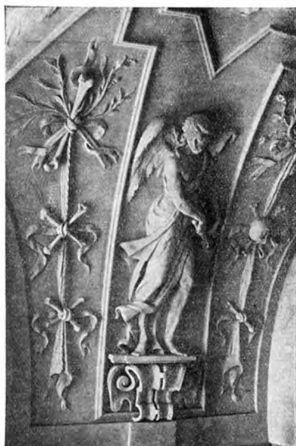
Sv. Hora. Dušičková kaple. Santino Ceregheti 1676: Anděl s kropenkou.

Dušičková pobožnost na Sv. Hoře. Na svátek Všech svatých, 1. listopadu bude odpol. o 1/2 4. hod. kázání. Po něm bude průvod k oltáři padlých vojinů. Tam zapějí zpěváci smuteční sbor, po něm vykonají se modlitby za zemřelé. Po nich bude druhý sbor Zdravas Královno. Po té v kostele svátostné požehnání a Zdravas. Na Dušičky, 2. listopadu bude v 8 hodin slavné requiem za padlé vojiny a 14 členy Matice Svatohorské. Po té průvod k oltáři padlých a k hrobce pod zvonící, kde vykonají se modlitby.