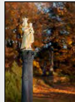
Fotografie na titulní straně časopisu:

Mariánský sloup na Svatohorském náměstí, v pozadí Kalvárie