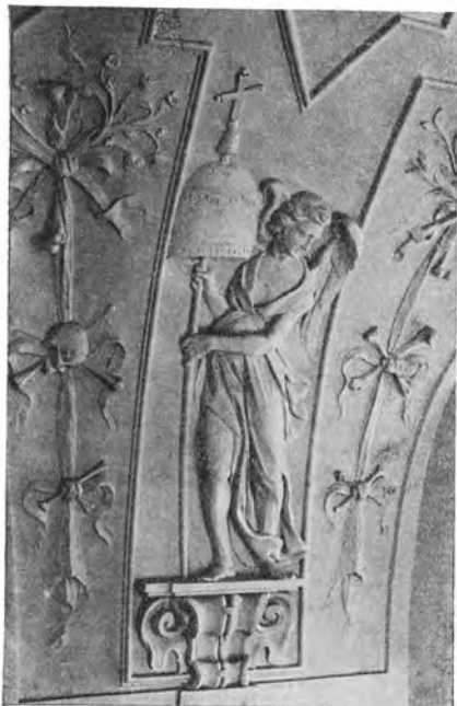
Sv. Hora. Dušičková kaple. Santino Ceregheti 1676: Anděl s pohřební umbelou.