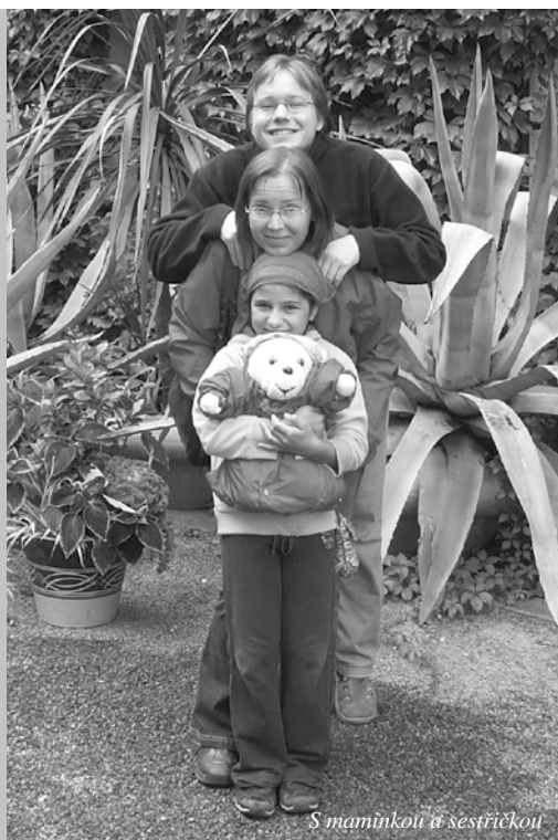
S maminkou a sestřičkou

Dokončení rozhovoru z minulého čísla časopisu