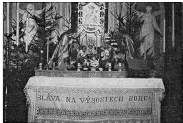
Báseň uveřejněna v r. 1943, fotografie jesliček je z r. 1942

když Ty se vracíš, jsa sluncem oděn, a vcházíš nesměle do stínu lidských střech — Můj Pane, nevidíš, že nejsem hoden Tě nésti na loktech?