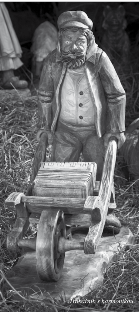
Trakařík s harmonikou

Finance jsou nejdůležitější. Chcete se zúčastnit tohoto projektu? Každý může do betléma dodat svoji figurku. Jak na to? Zájemce sdělí, jakou postavičku by rád v betlémě měl.