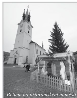
Betlém na příbramském náměstí