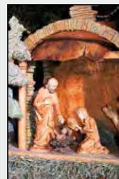
Fotografie na titulní straně časopisu: