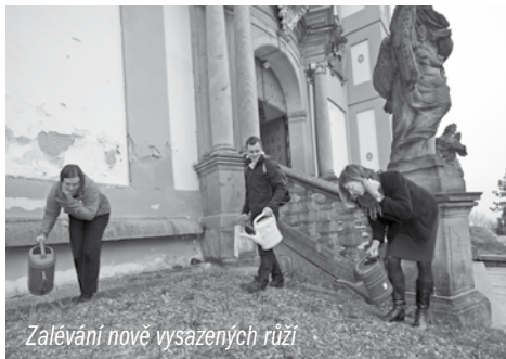
Zalévání nově vysazených růží