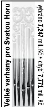
Velké varhany pro Svatou Horu

výběháno 7,247 mil. Kč • cihly 7,771 mil. Kč