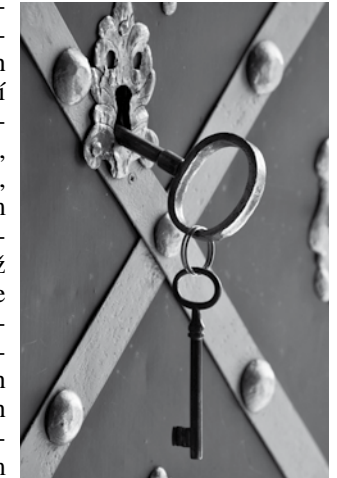
Stojím u dveří a klepu, praví Pán (srovn. Zj 3, 20)

me stát citlivějšími a vnímavějšími. Tento čas „bez světla“ můžeme využít jako možnost lepšího přijetí Světla, Naděje a Lásky, blízkosti očekávání a hledání toho Božího a lidského, toho podstatného v našem životě.