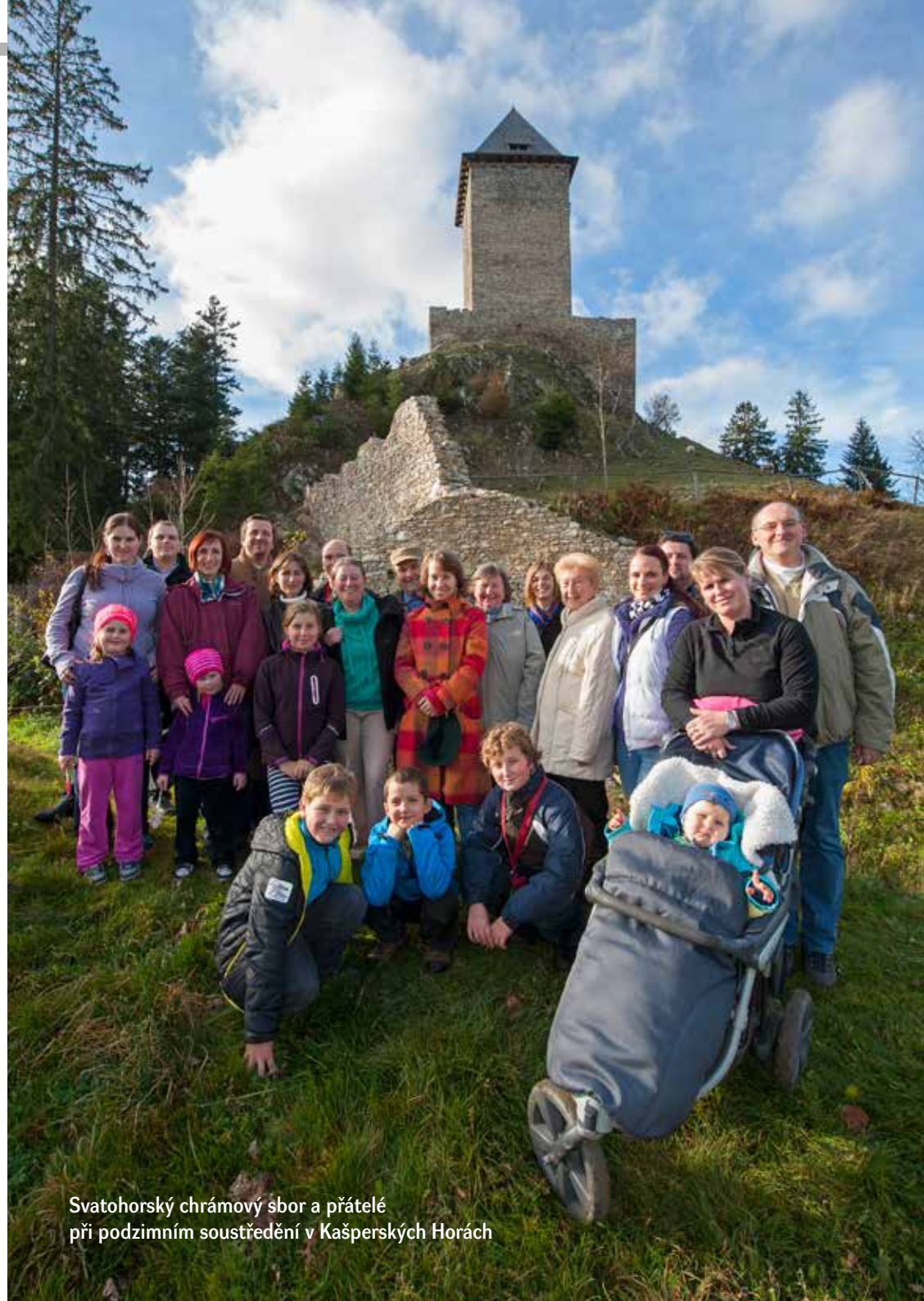
Svatohorský chrámový sbor a přátelé při podzimním soustředění v Kašperských Horách

BANKOVNÍ SPOJENÍ Česká spořitelna, a. s, č. ú. 523967309/0800. Zájemci o pravidelné odebírání pište na adresu redakce.