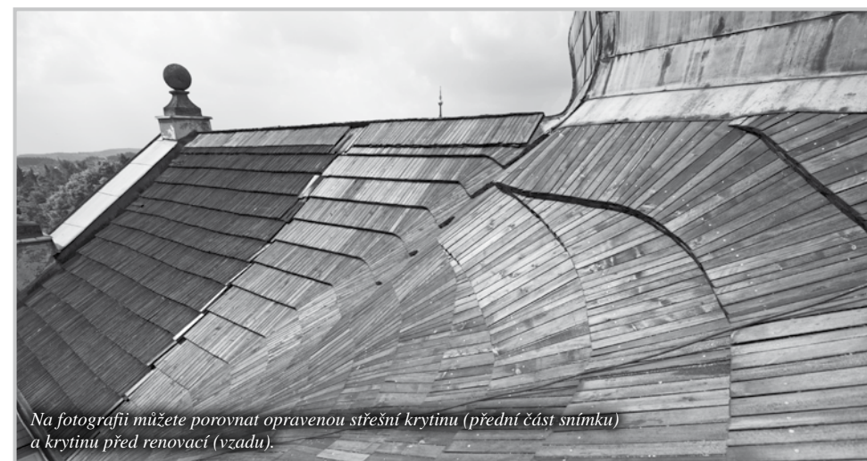
Na fotografii můžete porovnat opravenou střešní krytinu (přední část snímku) a krytinu před renovací (vzadu).