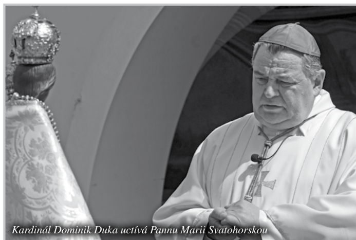
Kardinál Dominik Duka uctívá Pannu Marii Svatohorskou

Velké varhany pro Svatou Horu včetně 9.421 ml. Kč • chýbí 5.507 ml. Kč