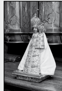
Fotografie na titulní straně časopisu: