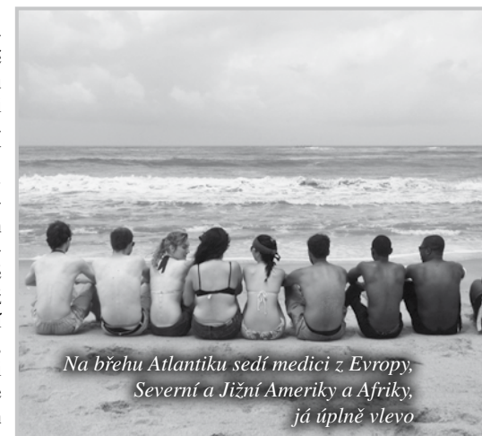
Na břehu Atlantiku sedí medicové z Evropy, Severní a Jižní Ameriky a Afriky, já úplně vlevo

Potvrdilo se mi, že ghanští lékaři jsou opravdu vynikající ve fyzikálním vyšetření, jelikož nemají běžně k dispozici technické vymoženosti jako my v Evropě. Takže se musí nezdědka spolehnout na to, že si dobře všimnou příznaků na kůži či nehtech, správně vyhmatají orgány, poslechnou si apod. Někdy ale moderní techniku nemohou použít ani ne tak z důvodu (pokud tedy mluvíme pouze o Accře jakožto hlavním městě – jinde je chudoba ještě větší), že by tam tyto věci vůbec neexistovaly, spíš si např. takové CT-vyšetření pacient není schopný zaplatit. Ale tak jako tak vždy napřed zvažují, zda je vůbec nutné udělat krevní obraz či EKG, protože to samozřejmě něco stojí. U nás jsou taková vyšetření naprosto automatická. Kromě toho je všude špína, hluk a pacient nemá žádné soukromí. V České republice je prostě luxus. I když třeba na vedlejším lůžku pacient chrápe.