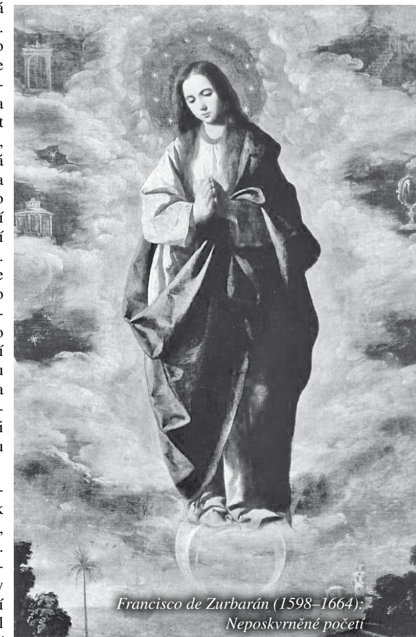
Francisco de Zurbarán (1598–1664): Neposkrvněné početí

Když hledíme na sochy a obrazy Neposkrvněné, mohli bychom si položit otázku, jak asi vypadala Maria po vnější stránce. Víme, že měřítko vnější krásy jsou velice relativní. Každý národ má svůj ideál krásy dívek a mladých žen. Jim dal Pán do vínku krásu, aby přinášely do světa trošičku jakýsi odlesk Boží krásy. Sešli se Japonci a evropský cestovatel a ten Evropan se ptal Japonce, jak se mu líbí evropské ženy. On mu odpověděl: „Ano, jsou krásné, ale pro mne a pro nás jsou nejkrásnější Japonky“. Kdybychom se dívali na čínské Madony, jsou ušlechtilé, ale je to jiná krásu. A kdybychom se dívali na Madony afrického kontinentu, byla by nám jejich krásu vzdálená. Každý národ má své měřítko. Vnější krásu je velmi relativní, ale můžeme s účinností říci, že krásu duše vždycky nějakým způsobem proniká, postupuje navenek, do pohledu očí, do výrazu tváře, do celého člověka. Můžeme si představit, že Panna Maria byla, jak z ní pronikalo to nejčistší, co v ní bylo, krásná i po stránce tělesné. Můžeme se na ni dívat jako na Columba formosissima – holubičku nejspanilejší.