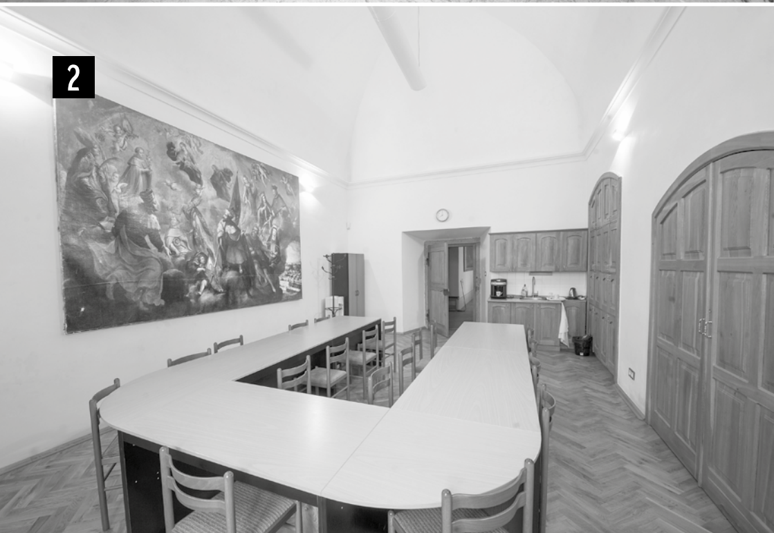
Farní sál. Mobiliiář, který nebylo možno vystěhovat, byl zabezpečen proti poškození