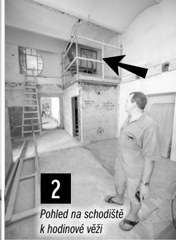
2 Pohled na schodiště k hodinové věži