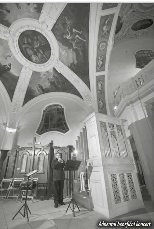
Adventní benedikční koncert