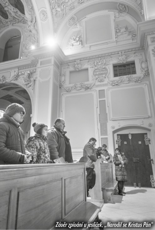
Závěr zpívání u jesliček, „Narodil se Kristus Pán“