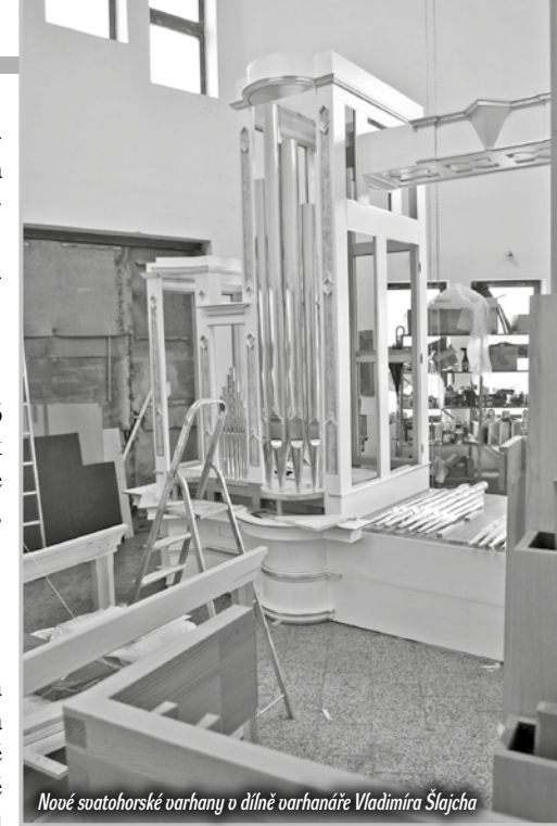
Nové svatohorské varhany v dílně varhanáře Vladimíra Šlajcha

Všechny práce, které mohly být provedeny v dílně varhanáře pana Šlajcha, jsou hotové. V loňském roce bylo provedeno lakování a zlacení skříní varhan a započaly řezbářské práce. Tyto práce podpořil opět dárcе z Prahy v hodnotě 900 tisíc Kč. Velmi důležitá je však také podpora od drobných dárců a také stále pokračuje adopce jednotlivých píšťal. Celkem je pro adopci k dispozici 122 prospektových (viditelných) píšťal + 30 píšťal jazykových nejsilnějšího pedálového rejstříku Posauunu + 2 zvonkohry. Cena adopce se pohybuje v rozmezí 1.000,- až 150.000,- Kč podle velikosti píšťaly. Bližší informace je možné získat na webových stránkách Svaté Hory http://svata-hora.cz/varhany/adopce/ . Prosíme Vás proto o pomoc a předem Vám děkujeme