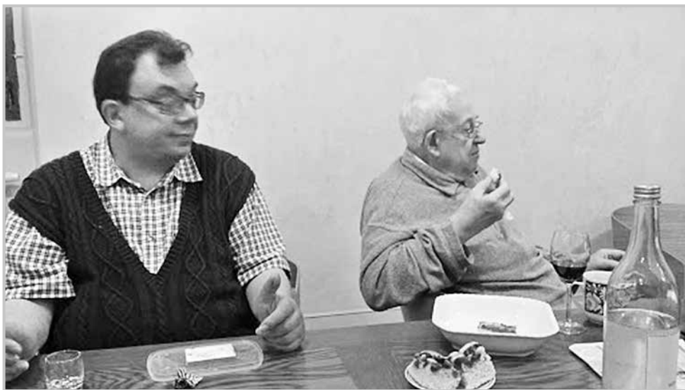
V komunitě redemptoristů na Svaté Hoře

Máte zkušenosti s dětskou pastorcí, např. z předešlých působišť? Myslíte si, že je třeba volit pro děti specifický přístup slavení mše svaté a přizpůsobovat ji