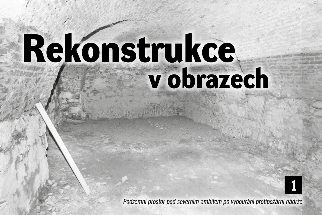
Podzemní prostor pod severním ambitem po vybourání protipožární nádrže