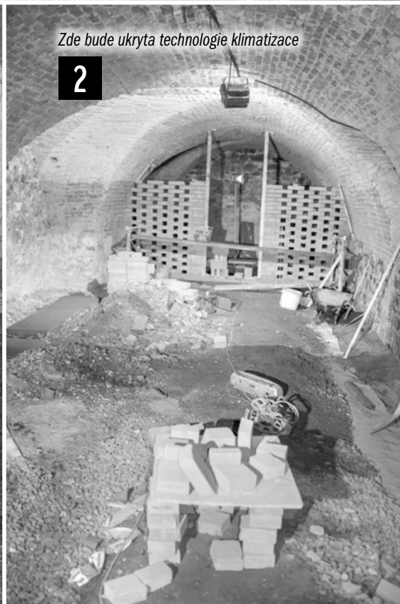
Zde bude ukryta technologie klimatizace