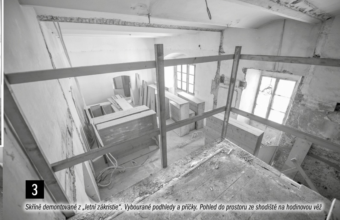
3 Skříně demontované z „letní zákristie“. Vybourané pohledy a příčky. Pohled do prostoru ze schodiště na hodinovou věž