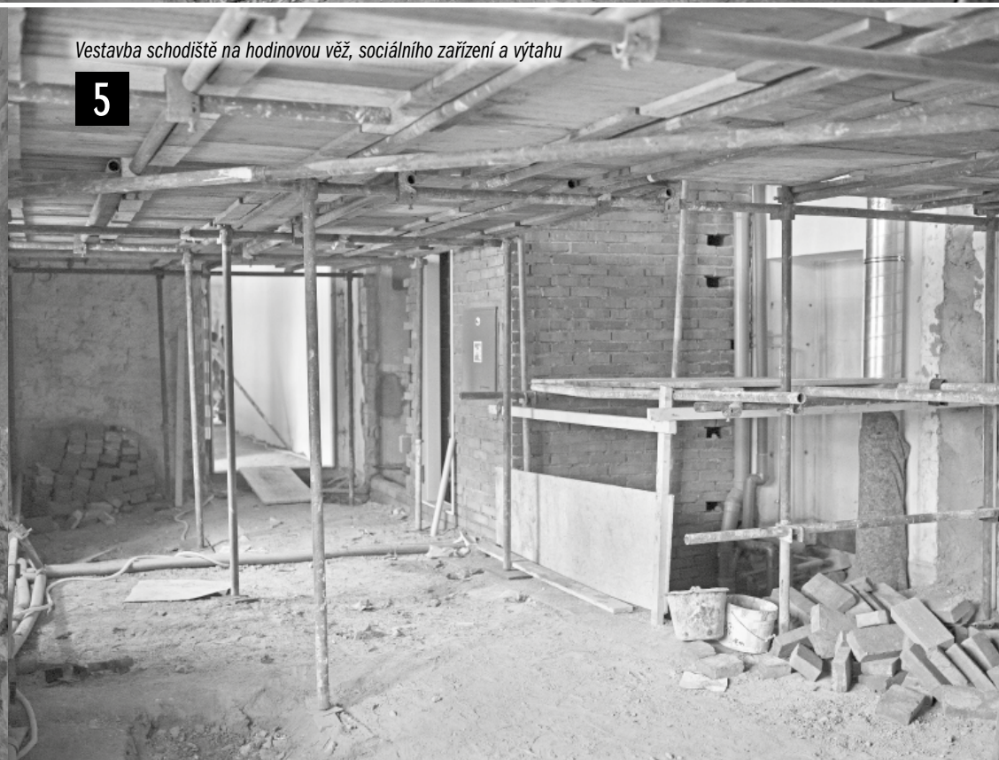
5 Vestavba schodiště na hodinovou věž, sociálního zařízení a výtahu