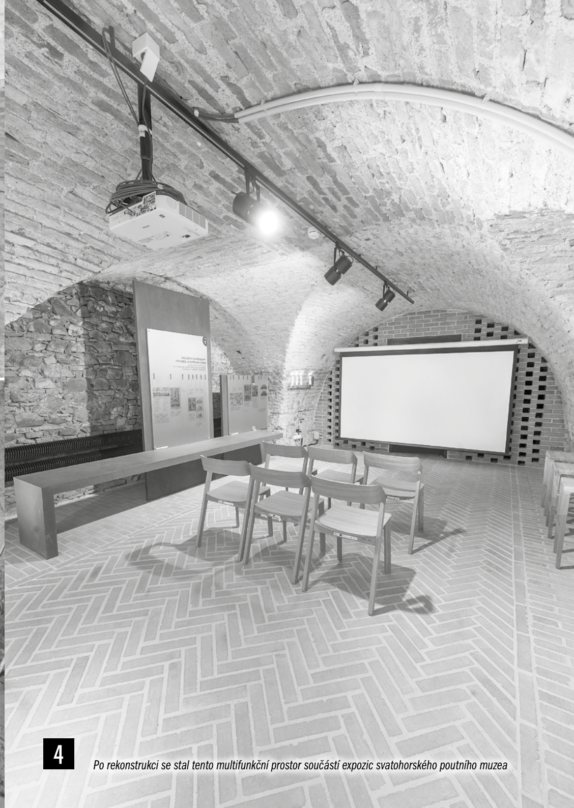
Po rekonstrukci se stal tento multifunkční prostor součástí expozic svatohorského poutního muzea