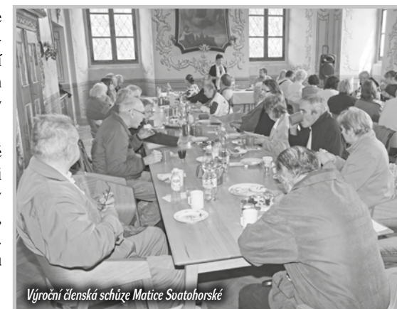
Výroční členská schůze Matice Svatohorské

Akce probíhala za podpory města Příbram.