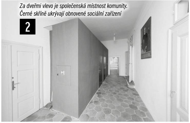
Za dveřmi vlevo je společenská místnost komunity. Černé skříně ukrývají obnovené sociální zařízení