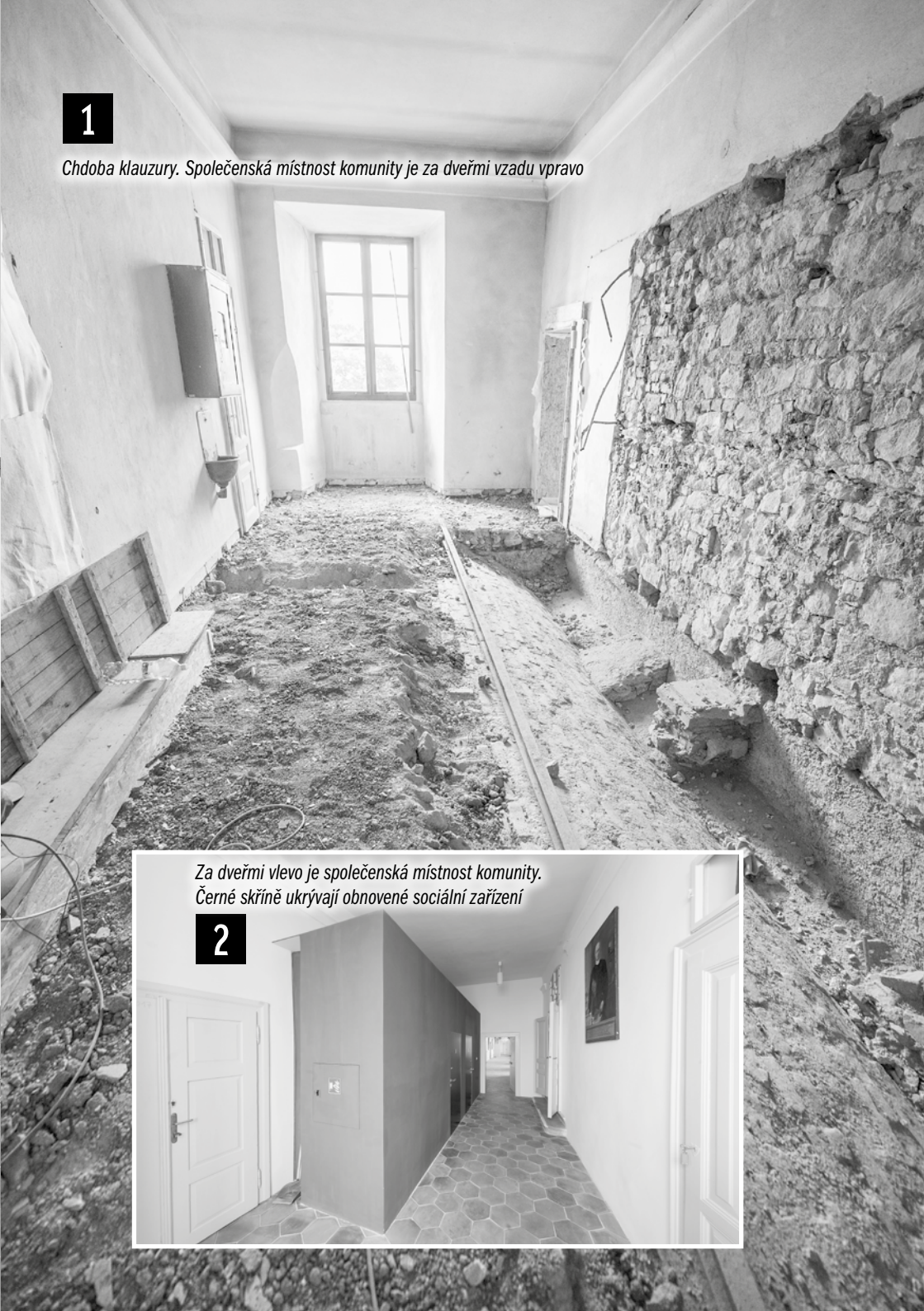
Chdoba klauzury. Společenská místnost komunity je za dveřmi vpravo