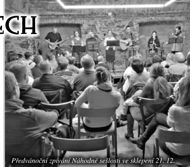
Předvánoční zpívání Náhodné sešlosti ve sklepení 21. 12.