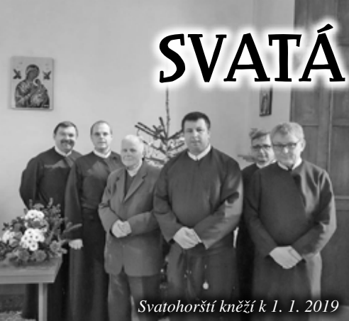
Svatohorští kněží k 1. 1. 2019