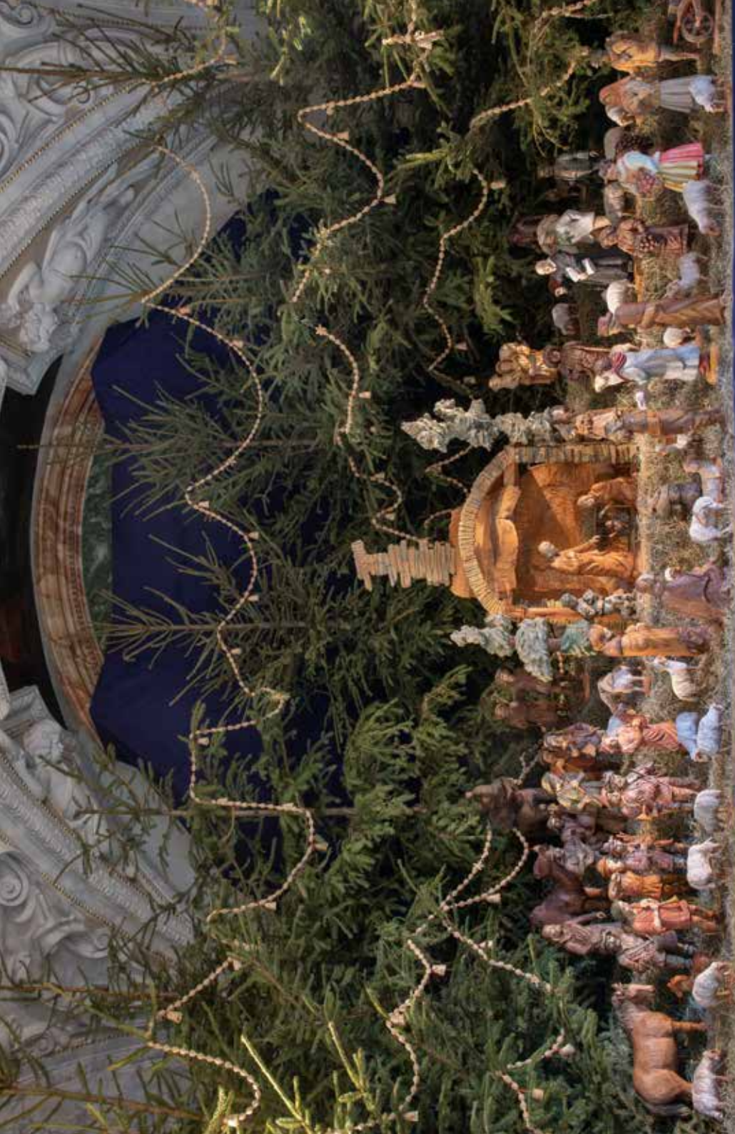
Svatohorský betlém o Vánocích 2019