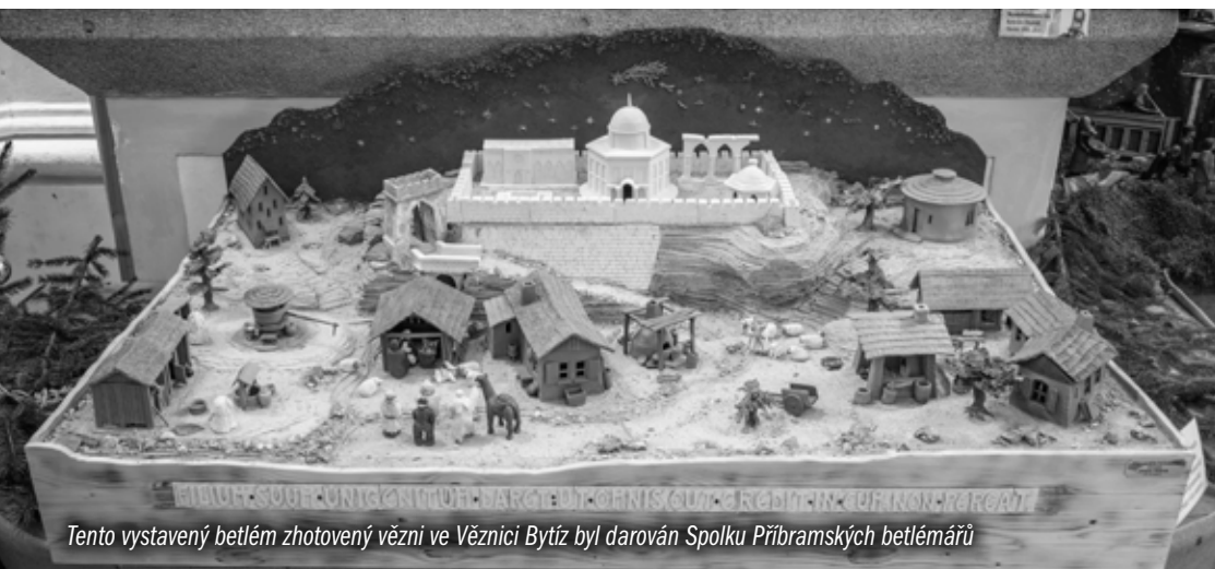
Tento vystavený betlém zhotovený vězňi ve Věznicí Bytč byl darován Spolku Přibramských betlémářů