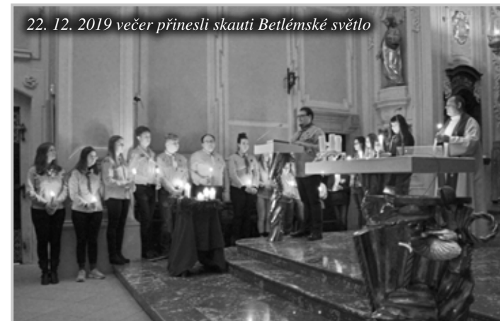
22. 12. 2019 večer přinesli skauti Betlémské světlo