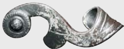
Detail kování dveří