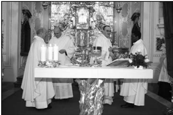
Mše svatá na Zelený čtvrtek