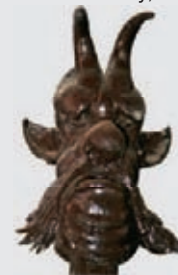
Detail kování brány Pražské kaple