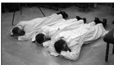
Svěcení nových jáhnů