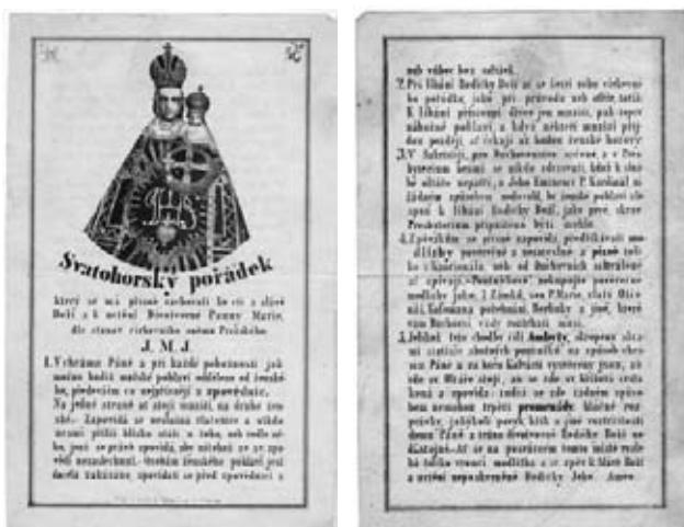
K článku Svatohorský pořádek