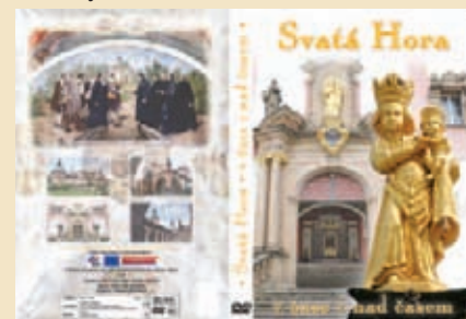
Televizní film s názvem „Svatá Hora v čase i nad časem“

Nabídnuté tituly se mohou stát milou připomínkou pouti na Svatou Horu ale také vhodným dárkem.