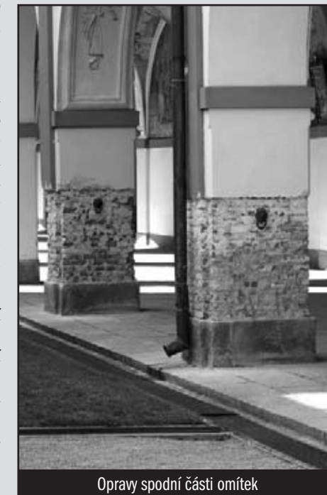
Opravy spodní části omítek