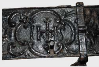
Detail kování zámku v Kapli Matky ustavičné pomoci