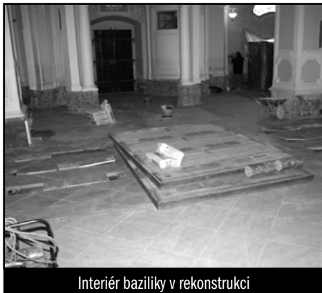
Interiér baziliky v rekonstrukci