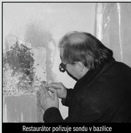
Restaurátor pořizuje sondu v bazilice