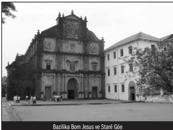
Bazilika Bom Jesus ve Staré Góe

Náboženským centrem Staré Góy je bezesporu bazilika Bom Jesus z roku 1605, která stojí na druhé straně náměstí než katedrála Santa Sé. Roku 1946 se stala první papežskou bazilikou v Indii. V boční lodi vlevo od presbytáře stojí oltář, na jehož vrcholu se nachází stříbrný relikviář s tělem sv. Františka Xaverského. Vlevo za oltářem lze vstoupit do sakristie, kde jsou další památky na světcův život jako jeho stříbrná socha či relikviář s jeho palcem.