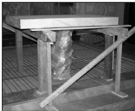
Instalace podlahového topení v bazilice