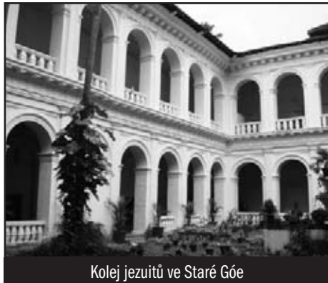
Kolej jezuitů ve Staré Góe

Pokud návštěvník ve vlhku a horku ještě neztratil síly, musí se prodrat davem obchodníků, kteří neustále nabízejí s křikem své zboží a vydat se naproti hlavnímu portálu baziliky na Holy Hill (Svatý Kopeček), kde můžeme vidět klášter svaté Moniky z roku 1637 a trosky opatství svatého Augustina.