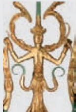
Detail kování mříže v sakristii baziliky