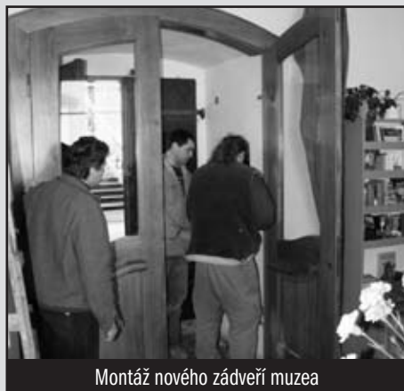
Montáž nového zádveří muzea